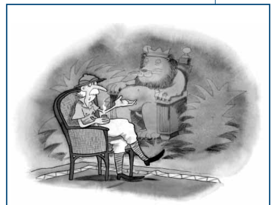
En el libro de Xabier Etxaniz se muestran 48 ilustraciones de 24 dibujantes.