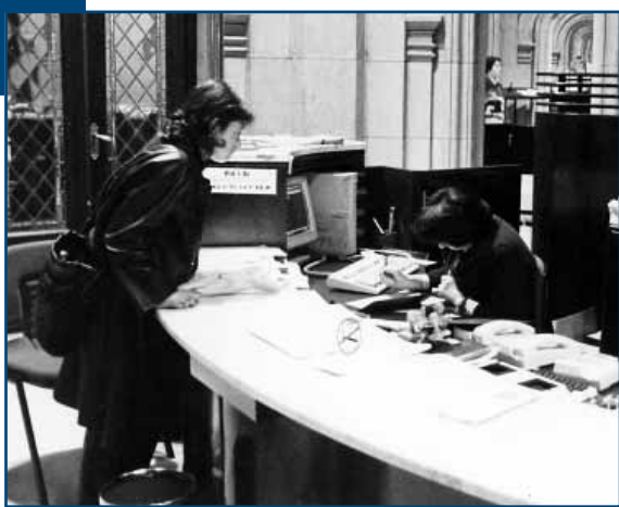
✕ Cada vez son más las personas que utilizan el euskera en la administración.

A través de los círculos de comunicación, se pretende lograr una actitud positiva de todos los miembros de la institución en relación al plan. Es, por consiguiente, muy importante hacer llegar la información sobre el plan y la normalización lingüística, así como difundir puntualmente información sobre todos los pasos que se están dando a todos los miembros, tanto dirigentes como trabajadores. Asimismo, otra de las funciones de los círculos consiste en facilitar la comunicación entre los miembros de las instituciones.