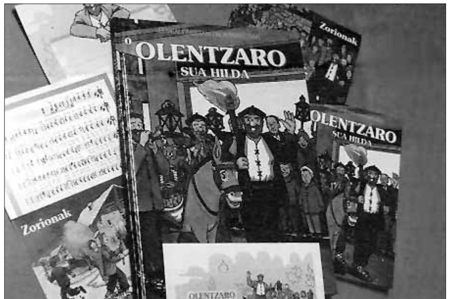
La Asociación Olentzaro ha publicado diversos materiales basados en el popular personaje.

Los productos de la Asociación Olentzaro estarán a la venta en todas las librerías y grandes superficies, así como en la Feria del Libro y Disco Vascos de Durango.