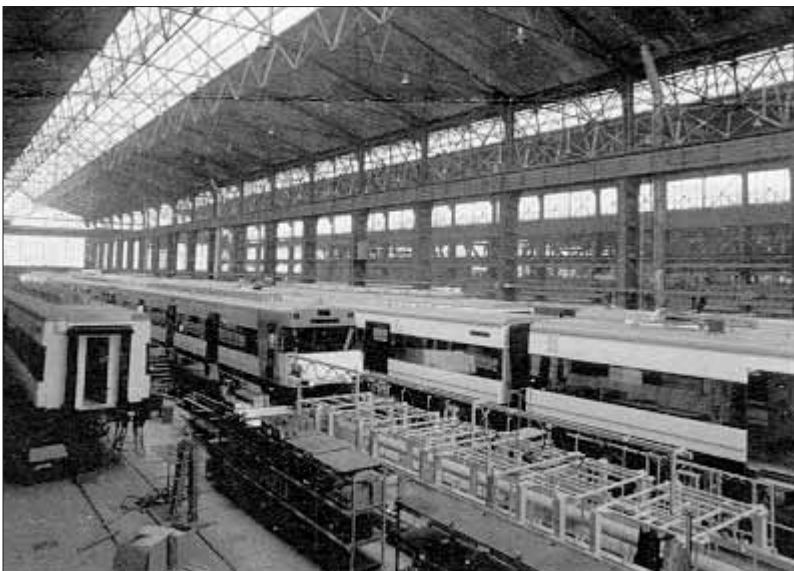
El plan de euskalduntización ha comenzado en las secciones de Acabado y Electricidad.

Al finalizar con este núcleo, dentro de dos años aproximadamente, se elegirá otro donde se darán los mismos pasos hasta conseguir una empresa que pueda funcionar en euskera.