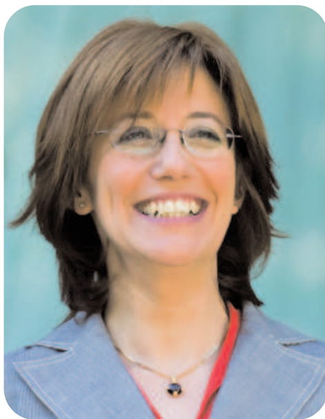
Blanca Urgell, Consejera de Cultura del Gobierno Vasco.

Nuestra política lingüística deberá reconocer, entender y respetar las diferencias, los derechos y las libertades de la ciudadanía vasca. Pero el reconocimiento de determinados derechos no debe entrar en contradicción con los derechos fundamentales de toda la ciudadanía. Es por eso por lo que tenemos la clara voluntad de promover una política lingüística con el mayor nivel posible de consenso social y político, negociándola con los diversos agentes socio-políticos, e integrando las aportaciones de los mis-