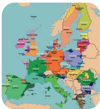
Mapa de las lenguas de Europa.

El Consejo de Europa destaca la creación de Elebide y anima a “continuar impulsando la normalización del euskera en la Ertzaintza y en Osakidetza”.