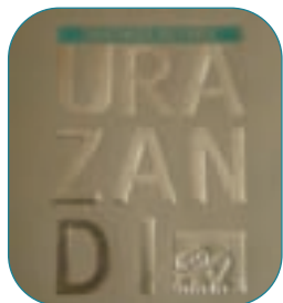
Portada del libro Santiago de Chile .