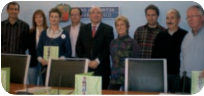
Acto de presentación (29-10-2008).

Recientemente, la Viceconsejería de Política Lingüística del Gobierno Vasco ha editado y presentado dos nuevas entregas de la colección Bidegileak : las correspondientes a los números 51 y 52. Están dedicadas a escritores clásicos e impulsores del euskera contemporáneos.