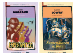
Esperantza y Sumendiaren azpian .

Las traducciones han sido publicadas por Elkar y Alberdania. Ambos trabajos fueron escritos entre los años 1936 y 1937. La novela Esperantza cuenta una historia que transcurre en la guerra civil. Por otra parte, Sumendiaren azpian refleja el día a día de una persona con problemas derivados de su adicción al alcohol ●