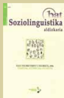
Kale neurketaren V. neurketa, 2006. Emaizak, azterketak, gogoetak Bat Soziolinguistika aldizkaria