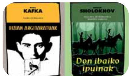
Bizian argitaratuak y Don Ibaiko ipuinak .