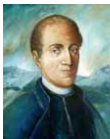
P.P. Astarloa (F. de Vicente, 1998).

Se puede consultar la colección Bidegileak en www.euskara.euskadi.net .