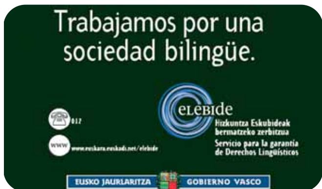
Imagen de la campaña de publicidad.

La Viceconsejería de Política Lingüística recientemente ha puesto en marcha una campaña de publicidad que gira alrededor de dicho lema. Mediante esta campaña se quiere proclamar la igualdad real de oportunidades de uso del euskera y castellano.