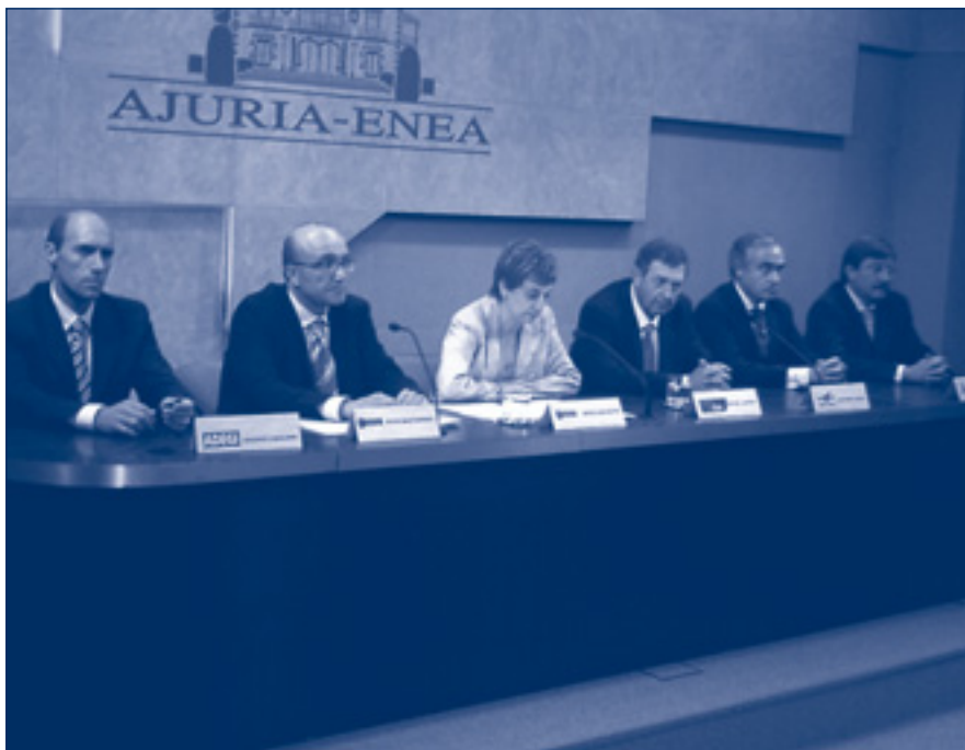
El Gobierno Vasco y las asociaciones empresariales firmaron el convenio el 6 de septiembre.

Este marco de referencia ha sido debidamente contrastado con las empresas que cuentan con planes de euskera así como con las empresas de asesoramiento lingüístico, y en el futuro seguirá actualizándose con las aportaciones que se vayan realizando.