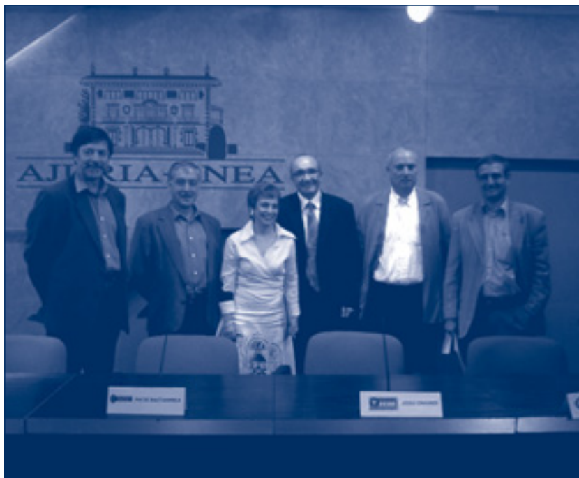
Firma del acuerdo entre el Gobierno Vasco y los sindicatos ELA, CCOO, LAB y UGT.