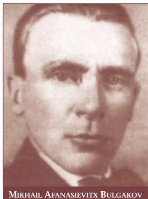
MIKHAIL AFANASIEVITX BULGAKOV

La colección Literatura Unibertsala comenzó su andadura en 1991 con la publicación de la obra Gulliver-en bidaiak , de Jonathan Swift, y desde entonces han sido editadas las obras de algunos de los más grandes escritores de toda la historia de la literatura universal. Chekhov, Stevenson, Gide, Goethe, Cortázar, García Márquez, Camus, Flaubert, Woolf,