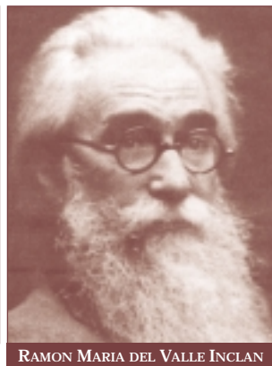
RAMON MARIA DEL VALLE INCLAN