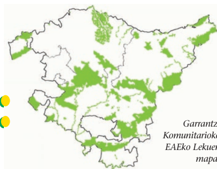
Garrantzi Komunitarioko EAEko Lekuen mapa.