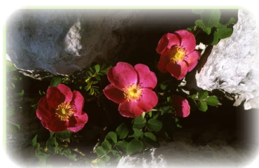
FIGURA ETA NEURRI BABESLEAK

latxaren artzaintzaren ondorioz sortutako belardiek hartzen dute basoen tokia. Aizkorri ondo kontserbatuta dauden habitatak fauna nabarmen baten babesba dira; izan ere, beste eremu batzuetan jada desagertutako hainbat espeziek bertan du aterpea. Eremu honek, gainera, balio handia du historia, kultura eta ondarearen aldetik, bertako ezaugarri baitira, besteak beste, San Adriango tunela eta galtzada, eta Arantzazuko Santutegia.