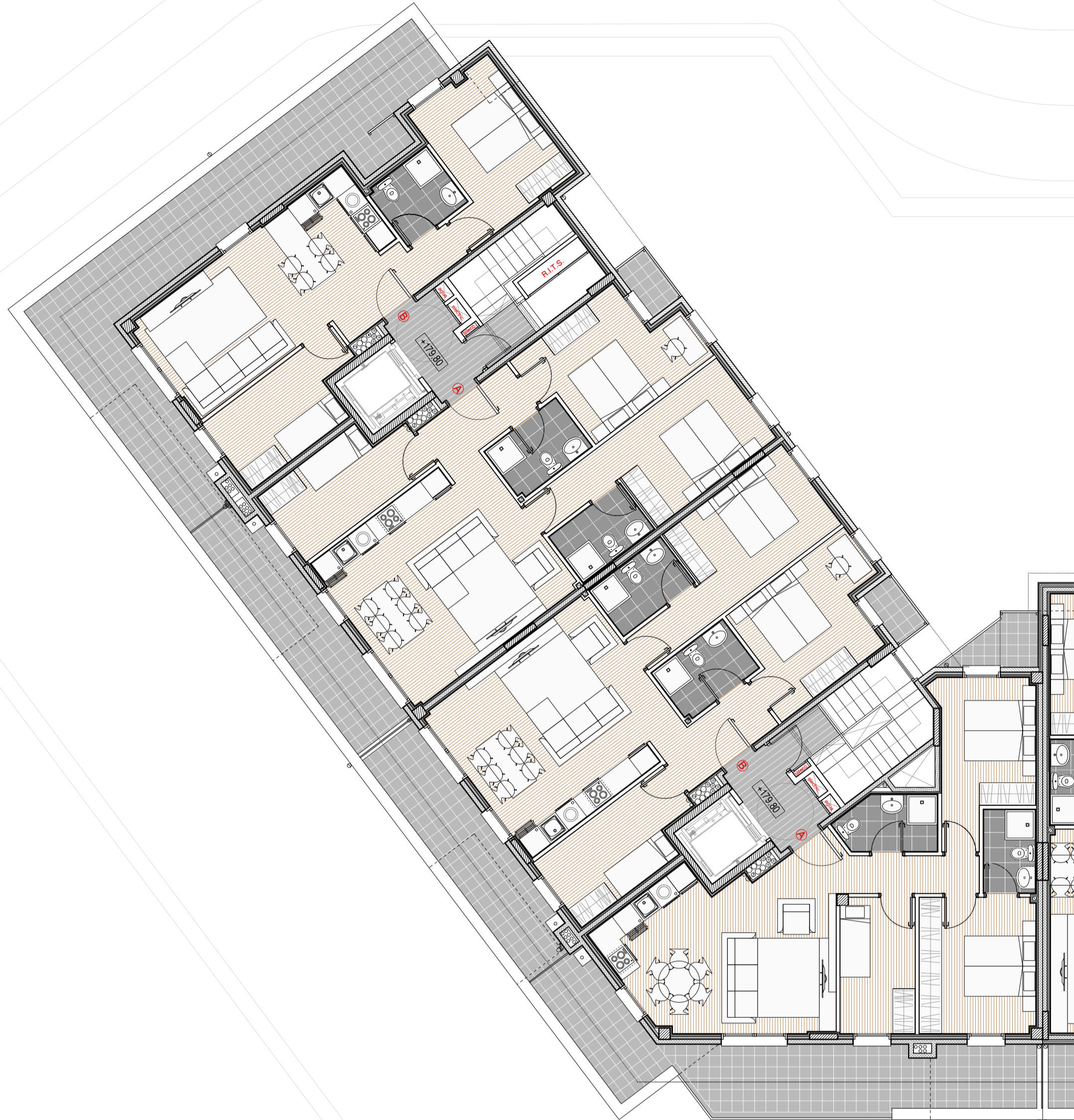
PLANTA ÁTICO (5ª)