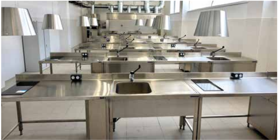
Gipuzkoako Espetxekeko irudiak. Sukaldea eta sukaldaritza tailerra.