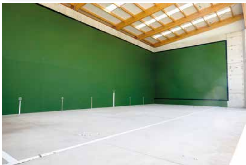
Gipuzkoako Espetxeke irudia. Frontoia.