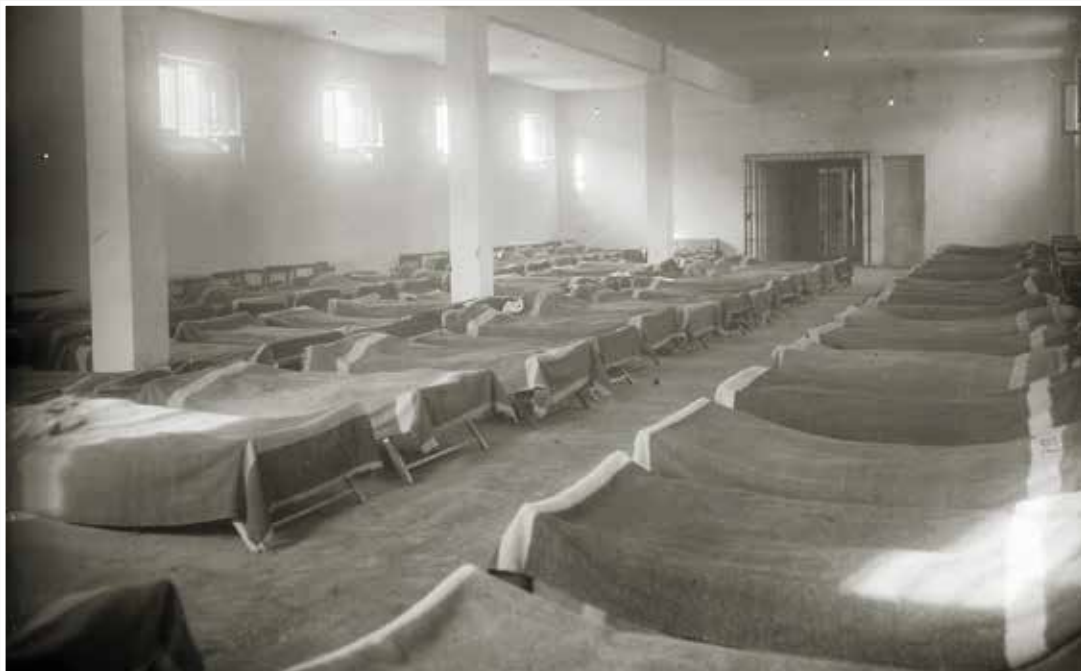
Martuteneko espetxea. Barnealdea. Oheak1948an.