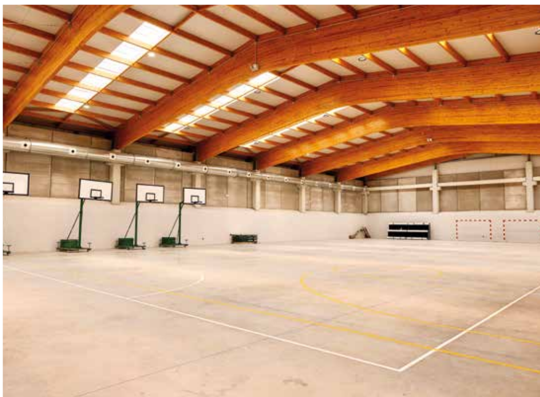
Gipuzkoako Espetxeko irudia. Kiroldegia.