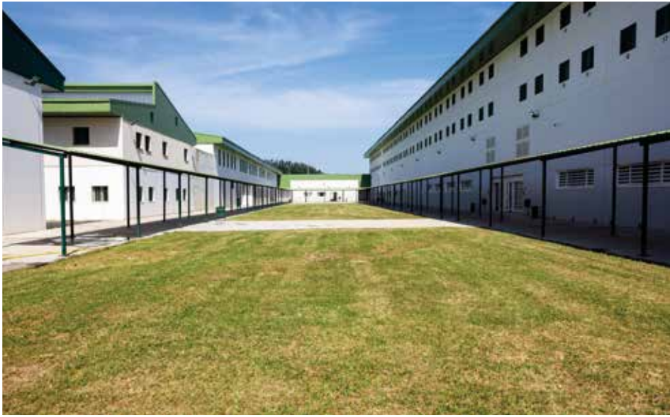
Gipuzkoako Espetxeko irudia. Patioa.