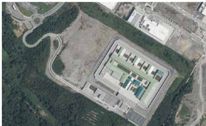
Geoeuskadi irudia 2025.