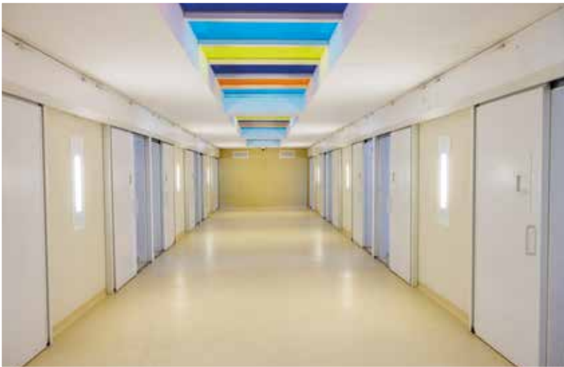
Gipuzkoako Espetxeko irudia. Gelaxkak.