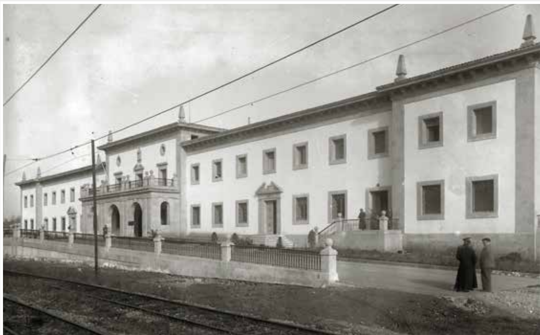
La cárcel de Martutene, tras la inauguración en 1948.