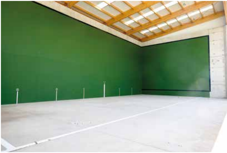
Imagen del Centro Penitenciario Gipuzkoa. Frontón.