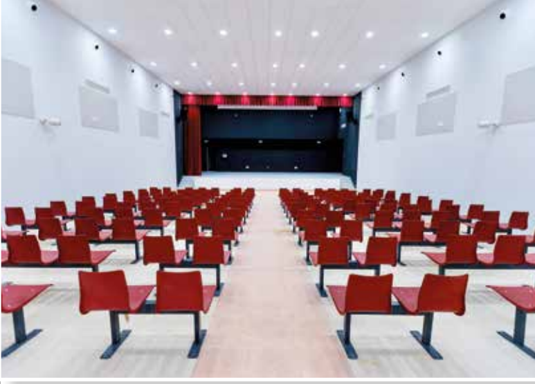
Salón de actos.