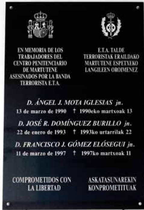
Placa en memoria de los trabajadores del Centro Penitenciario de Martutene asesinados.