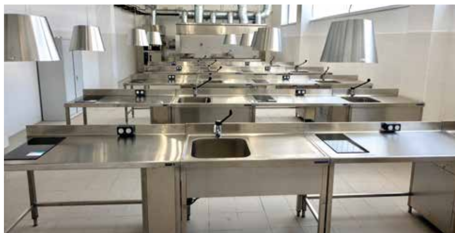
Imágenes del Centro Penitenciario Gipuzkoa. Cocina y taller de cocina.