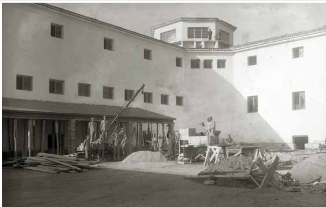
Obreros republicanos construyen la cárcel.