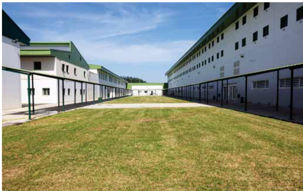
Imagen del Centro Penitenciario Gipuzkoa. Patio.