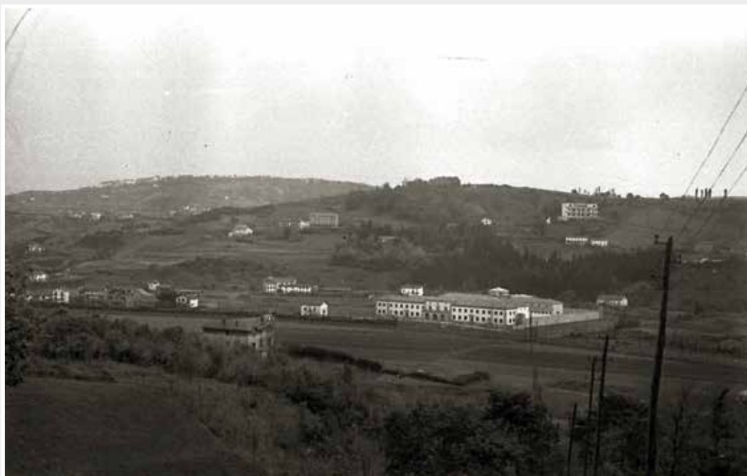
Vista panorámica de la prisión de Martutene. 1948.