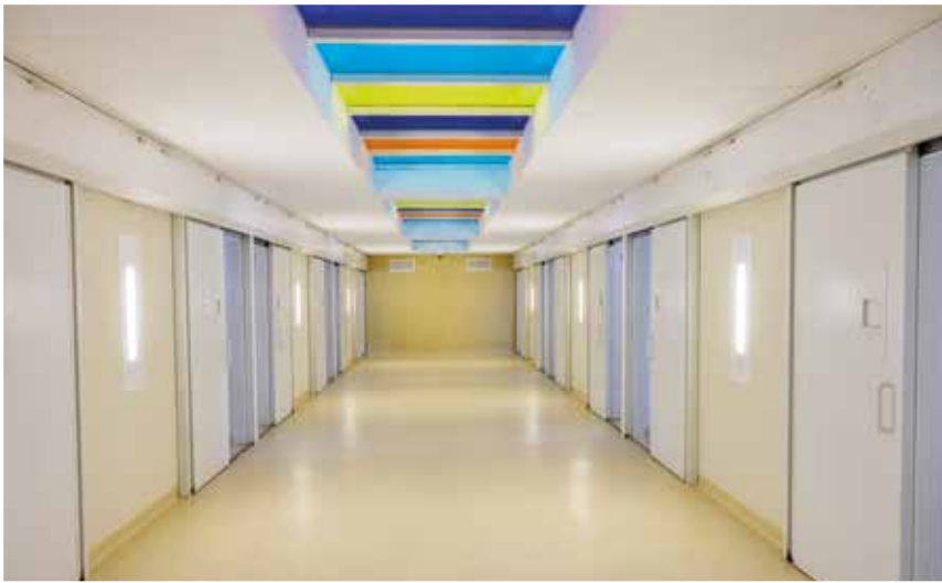
Imagen del Centro Penitenciario Gipuzkoa. Celdas.