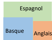
Modèle B (16%)

Certains domaines de connaissance sont enseignés en basque et d'autres en espagnol (en général, les mathématiques et l'apprentissage de la lecture et de l'écriture)