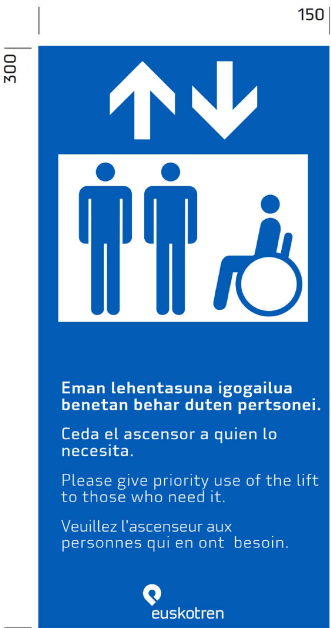
DESTINO ASCENSOR EN MEZZANINA (Lpm)