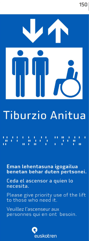
DESTINO ASCENSOR ANDÉN (Lpp)