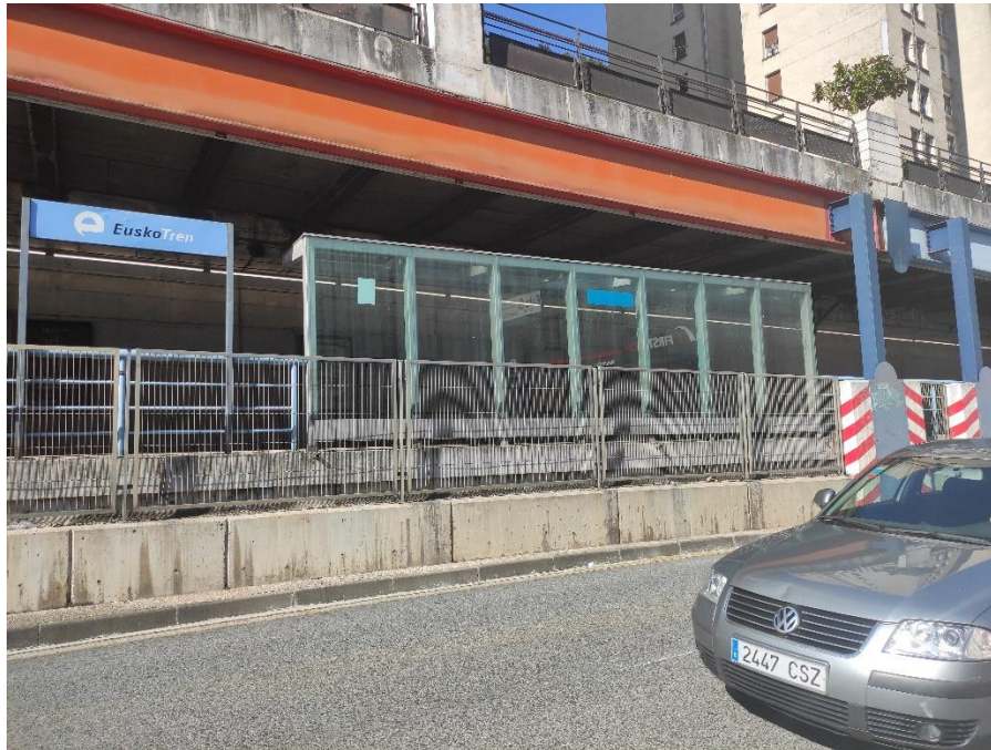
Marquesina con asientos en el andén sentido Bilbao