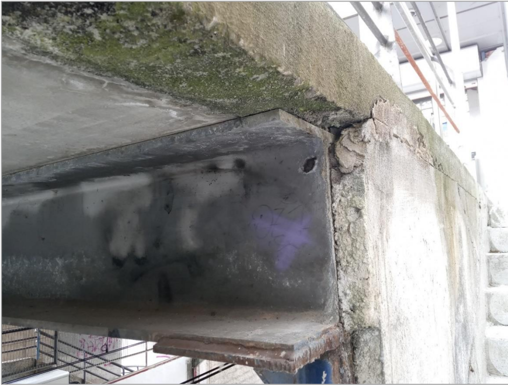
Estado actual estructura interior de la estación Unibertsitatea