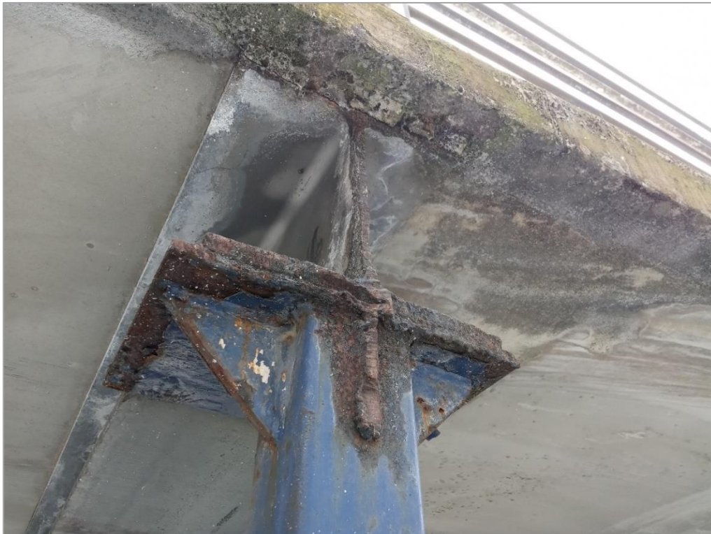
Estado actual estructura interior de la estación Unibertsitatea