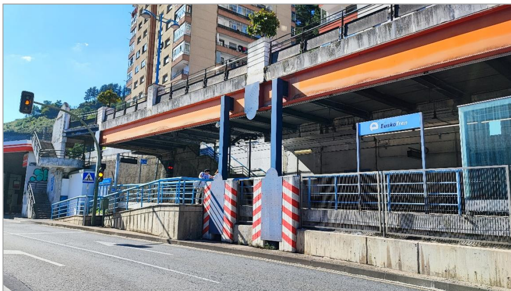
Zona acceso existente y andén sentido Bilbao por la calle Torrekua

A continuación, se muestra una serie de imágenes que muestran el estado actual en el que se encuentra el ámbito de actuación.