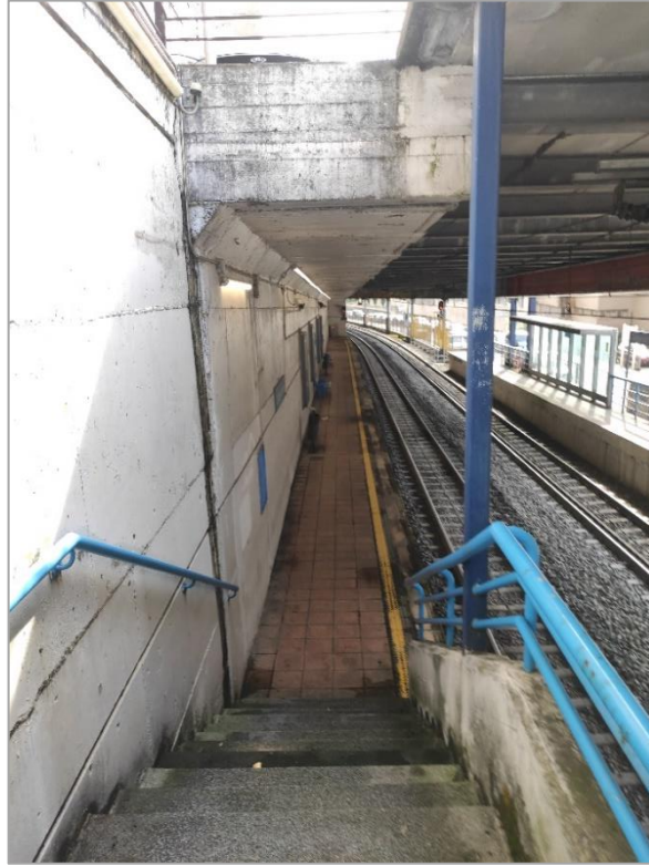
Acceso andén sentido Donostia