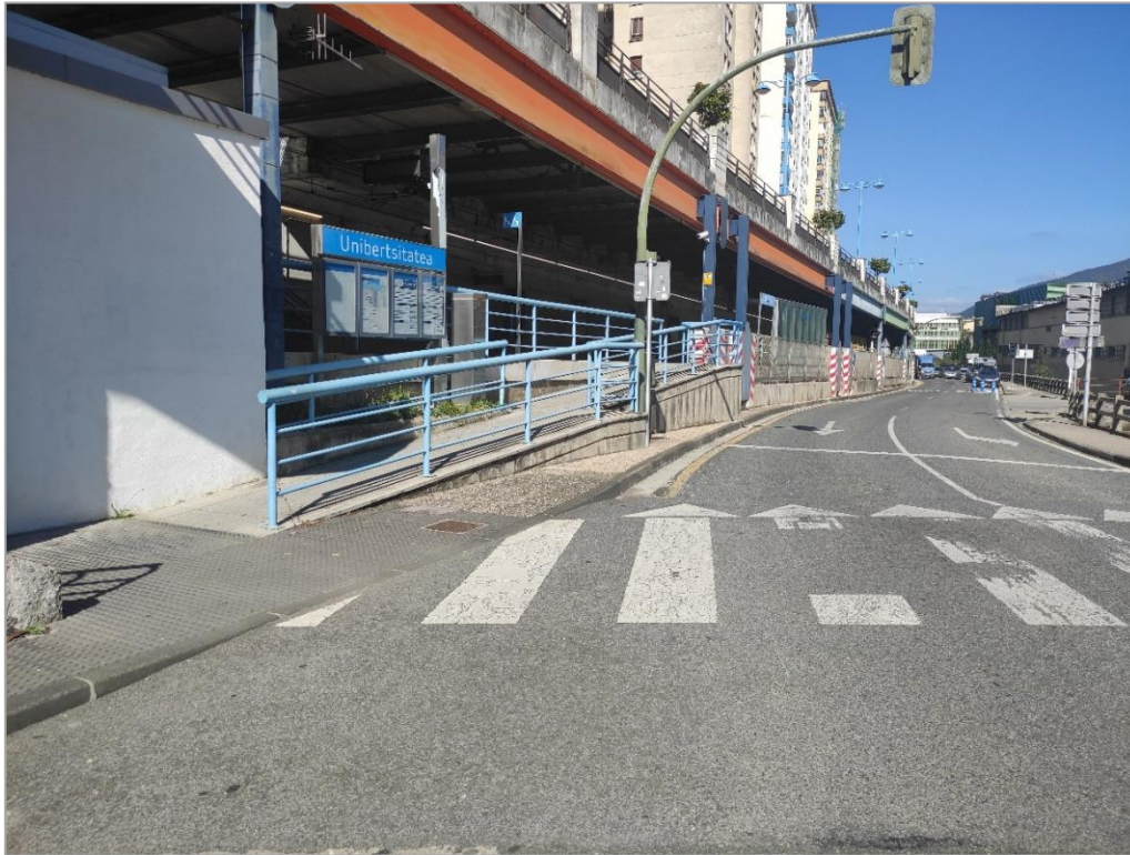
Rampa de acceso existente a andén sentido Bilbao estación Unibertsitatea