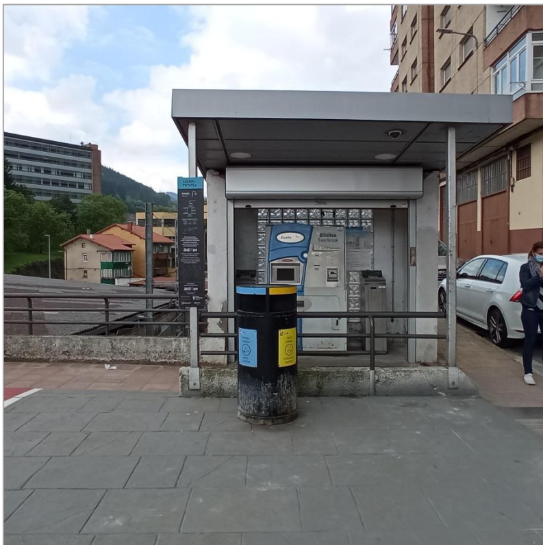
Marquesina y máquina expendedora en cubierta peatonal estación Unibertsitatea