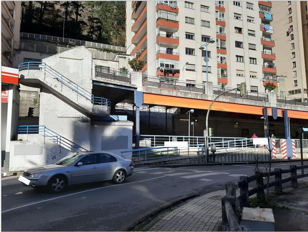
Núcleo de escaleras existente desde calle Torrekua a paseo peatonal superior de la estación