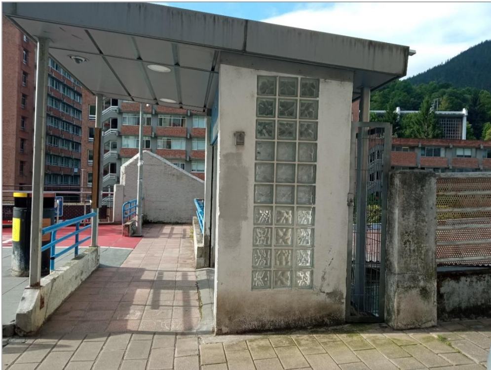
Marquesina y máquinas expendedoras existentes en paseo peatonal cubierta estación Unibertsitatea