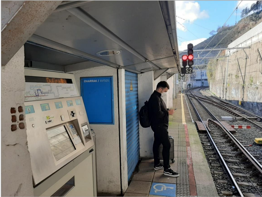
Máquinas expendedoras existentes andén sentido Bilbao