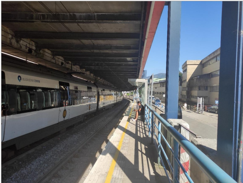
Andén sentido Bilbao de la estación Unibertsitatea