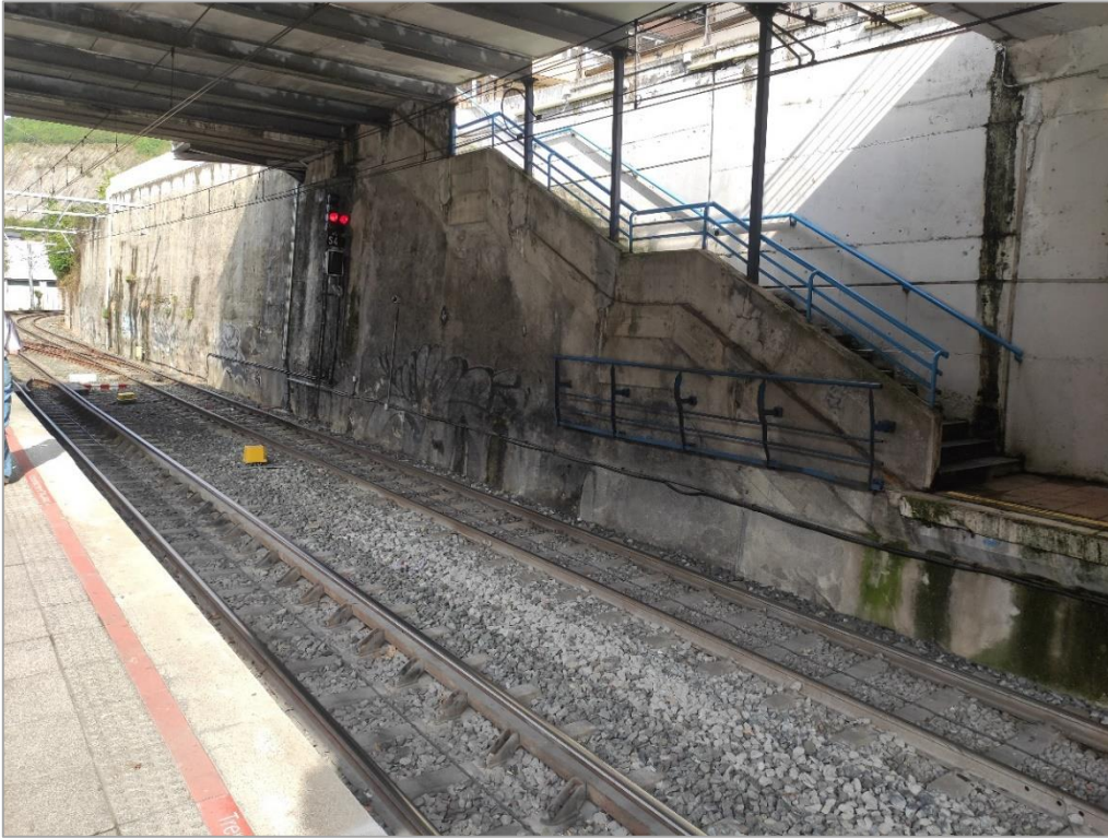
Vista interior andenes estación Unibertsitatea