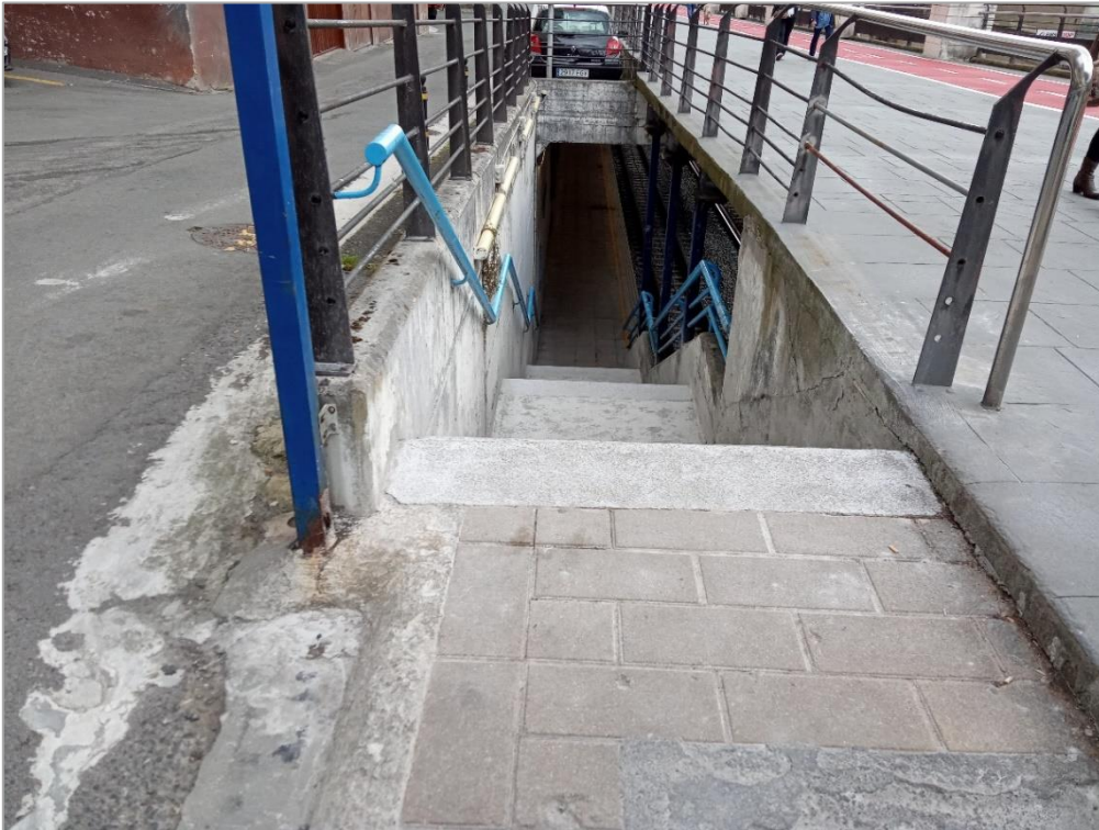
Acceso existente andén sentido Donostia