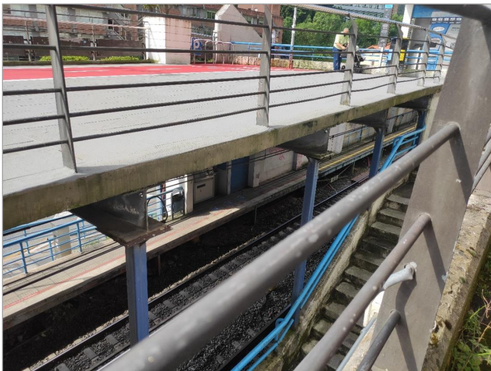
Acceso a andén sentido Donostia