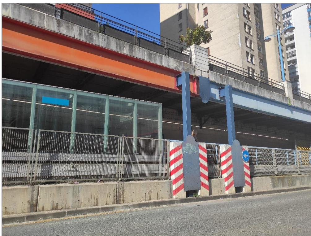
Andén sentido Bilbao desde la calle Torrekua