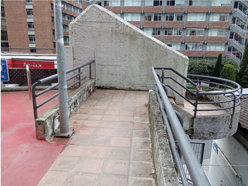
Núcleo de escaleras existente