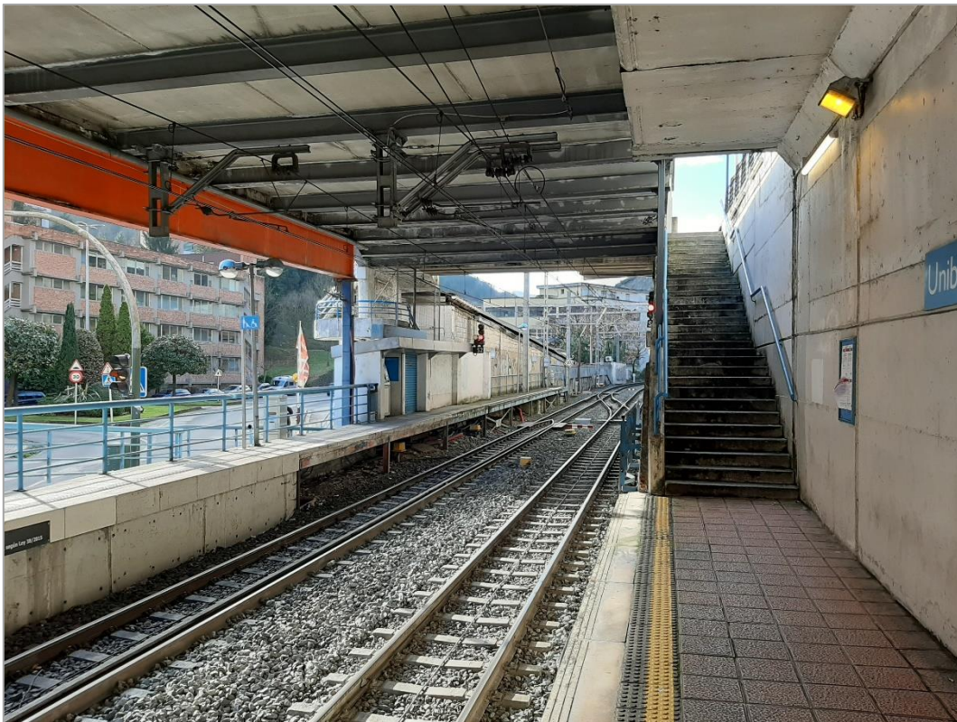
Andenes de la estación Unibertsitatea