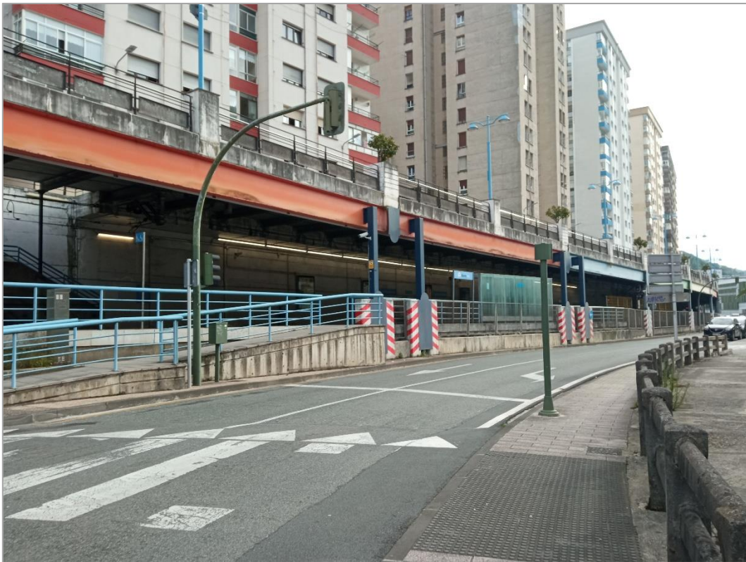
Vista general estación desde la calle Torrekua