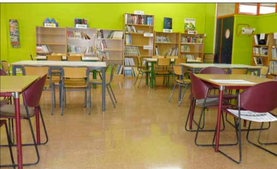
San Lorenzo Ikastetxearen liburutegiko ikasketa- eta lan-gunearen egungo egoera

Diagnostiko horren ondorioak oinarritzat hartuta hainbat proposamen egin genizkien ikastetxeei, hala nola gure lankidetzak aktiboa eskoletako liburutegiak martxan jartzeko, irakasle guztien eta guraso elkartearen inplikazioa, eta eskola eta Udalaren arteko hitzarmen bat sinatzea, alderdi bakoitzaren konpromisoak zehaztuz.