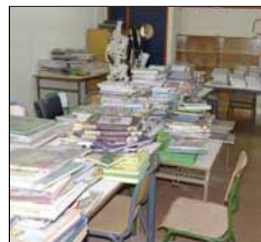
San Lorenzo Ikastetxeko liburutegiaren hasierako egoera

Hasteko, “Irakurketa udalerrian: erronkak eta ikuspegiak” jardunaldiak antolatu genituen 2010. urtean, Eusko Jaurlaritzako Kultura Sailaren laguntzarekin, zeinetan liburutegietako, hezkuntzako eta Euskadiko guraso elkarteetako ehun bat profesionalak parte hartu baitzuten. Jardunaldi haietan eskoletako eta udaletako liburutegiek irakurzaletasunaren sustapenean duten eginkizuna aztertu zen, bai eta eta bien arteko elkarreragina, gaiaren inguruko esperientzia praktikoak ere ezagutuz.