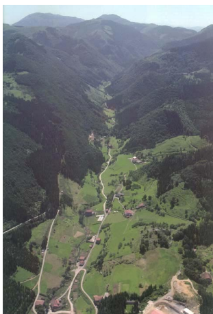
Kilimon errekaeren harana

c. Natura-parkeak, eskualdeaz gaindiko esparrukoak, foru-laguntzarekin eta Eusko Jaurlaritzaren laguntzarekin. Balio natural eta ekologiko handiko eta interes paisajistiko eta kulturalako Euskal Autonomia Erkidegoko espazio enblematikoak dira. Espazio hauek dagozkien antolamendu-planak izan beharko dituzte.