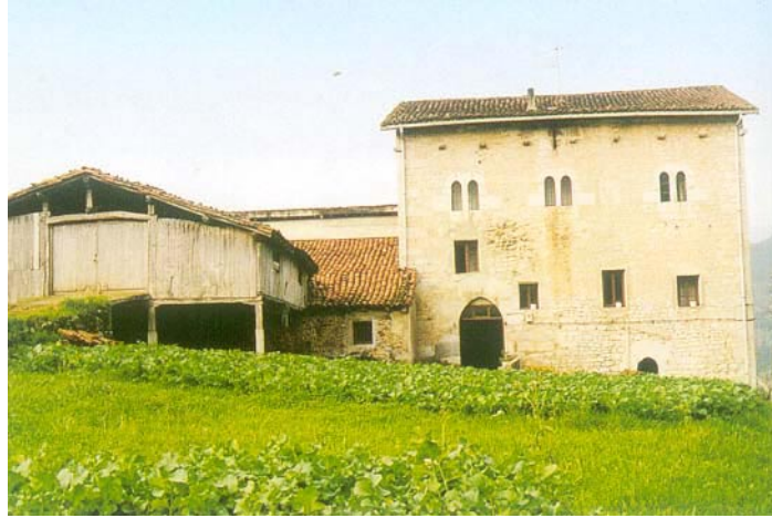
Zabale dorrea (Elgoibar)

1. Askotariko eskaintza ezartzea, ekipamenduak eta azpiegiturak eskariaren arabera antolatuz: