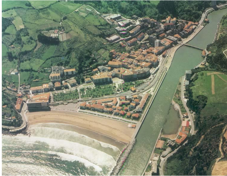
Deba ibaiaren bokalea

Uztailaren 27ko 160/2004 Dekretuaren bidez behin betiko onartu zen Lurraldearen Arloko Plan honek informazio aberatsa ematen du Deba ibaiaren bokalean definitutako 'Itsasadar' erako hezegunea karakterizatzeke.