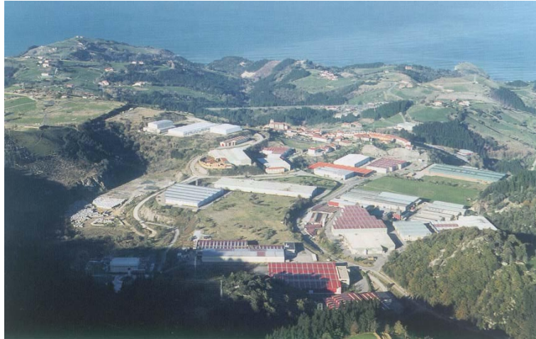
Itziar industria-poligonoa (Deba)

Prozesu hauetan administrazio publikoaren parte-hartzea zentratzea.