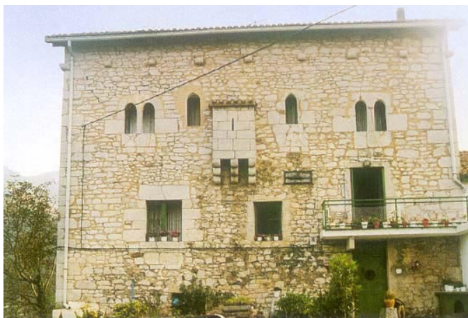
Zabale dorrea (Elgoibar)

2. Helburuak. Debabarreneko eremu funtzionaleko ondare naturalistikoan, arkeologikoan, historikoan eta kulturalen katalogatutako elementuak babestea eta kontserbatzea.