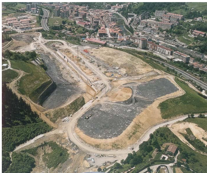
Albitzuri poligonoa, Elgoibarren