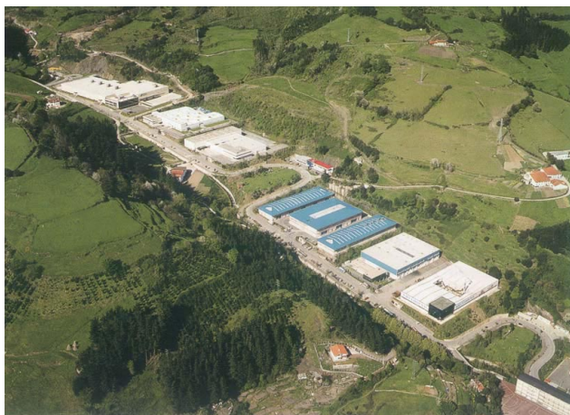
Azitaingain industria-poligonoa (Eibar)

Horrenbestez, lurzoru-eskaintza teorikoa ez da informaziotik ondorioztatzen dena, hutsik dauden lurzoru kalifikatu askok ez baitute benetako bideragarritasun handirik.