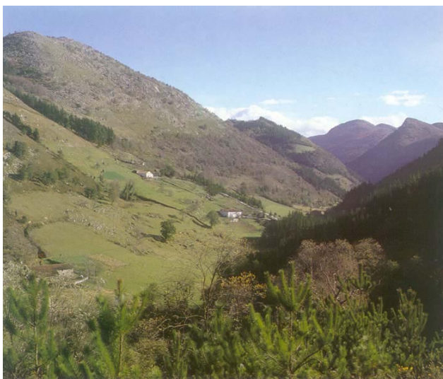
Lastur harana (Deba)

1. Egungo egoera: Bere ahalmen naturalari dagokionez, eremu funtzionalean desoreka larria dago lurzoruaren okupazioan, konifero exotikoen sail landatuak nagusitzen baitira, eremu funtzionaleko baso-estaldura osoaren %75 okupatzen dutela. Horrek biodibertsitatea murrizten du, paisaia soiltzen du eta lurraldearen ingurumen-arriskuak areagotzen ditu.