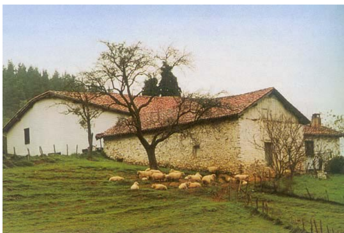
Akey baserria (Elgoibar)