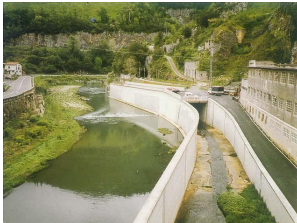
Kilimon errekaaren kanalizazioa (Mendaro)

3. Irizpideak. Ibai eta erreken hurbileko garapen berriei zuzendutako araudi zorrotza ezartzea.