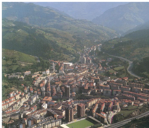
Eibar (Ego ibaiaren harana)

1. Egungo egoera. Gaur egun dagoen egoeraren analisiaren emaitzak Debabarreneko bizitegirako hiri-eremuetako batez besteko dentsitatea oso handia dela adierazten du ezbairik gabe.