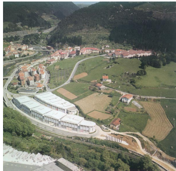
Industrialdea de Mendaro.