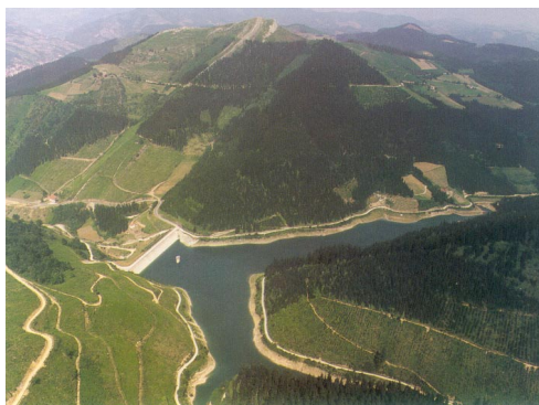
Emblase de Axiola.