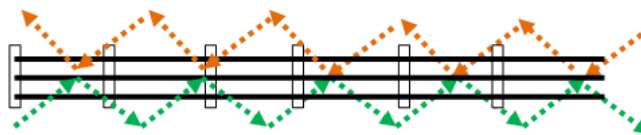
Figura 2. Ejemplo de muestreo de línea eléctrica área de evacuación mediante recorridos en zigzag.

Para ello, se realizarán prospecciones mediante un recorrido andando en zigzag a lo largo del trazado de la línea eléctrica y abarcando 25 metros a cada lado en un recorrido de ida y vuelta, como se muestra en la siguiente figura.