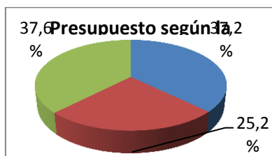
Gráfico 2. Presupuesto según relevancia al género. Departamento

El 62,4% del presupuesto se ha considerado de relevancia alta y media, es decir, puede incidir de una manera significativa en el logro de la igualdad de mujeres y hombres en la población a la que dirige sus políticas.