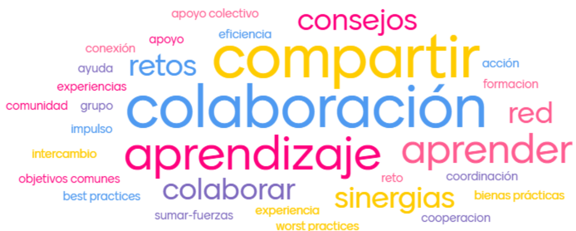
Iturria: 1. saio parte-hartzailean egina, bertaraturakoen erantzunetatik abiatuta