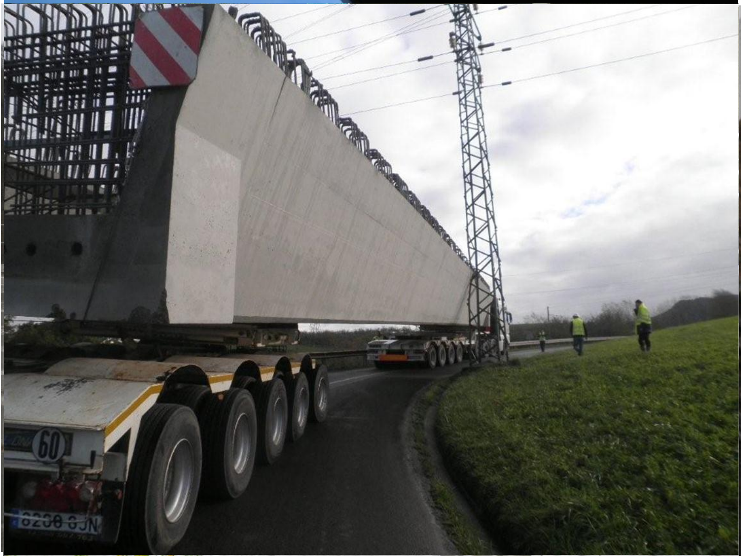
Tablero Prefabricado de Uban