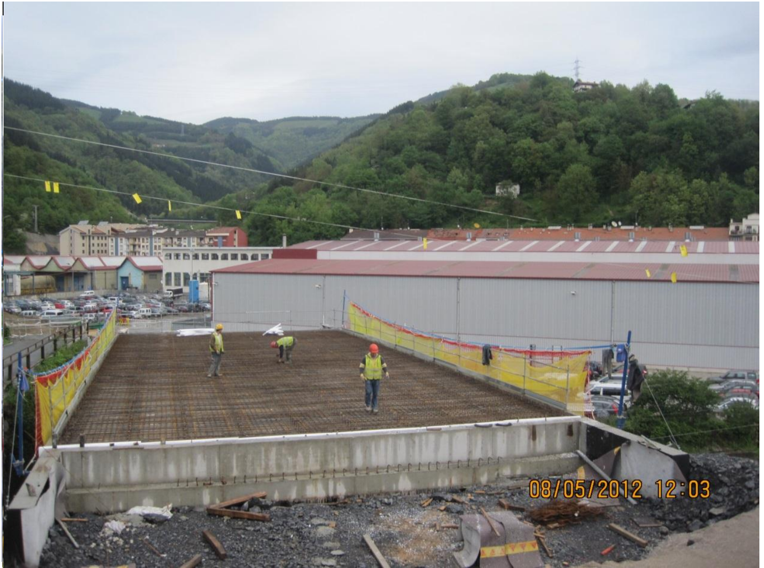
Tablero Prefabricado en Upabi