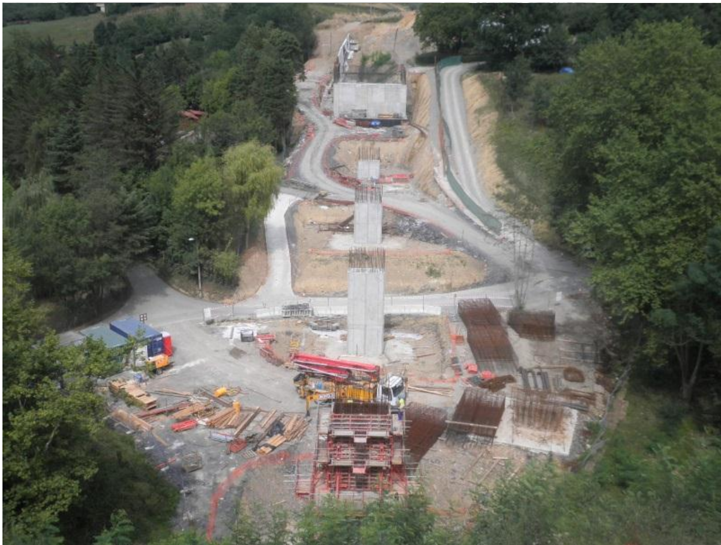
Pilas en el Viaducto de Uban