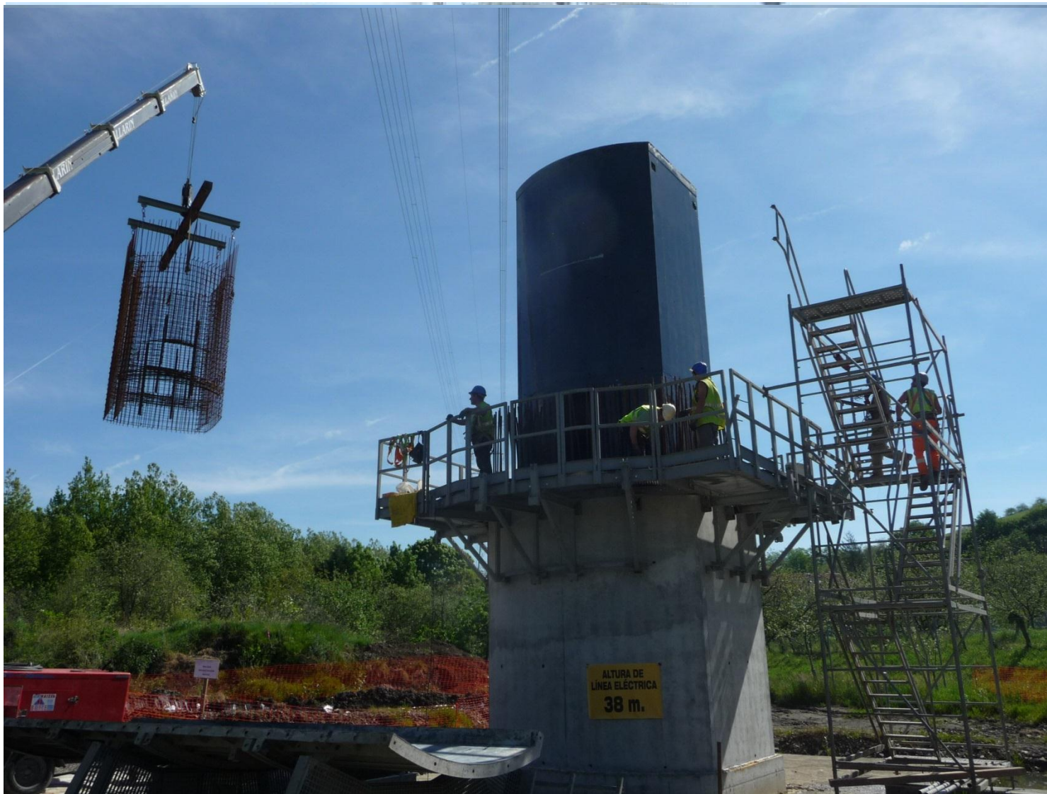
Pilas en el Viaducto del Urumea