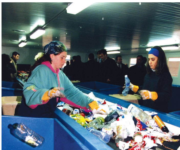
Aumentar la capacidad de gestión de residuos es una prioridad estratégica

El objetivo final de Euskadi de creación de riqueza y empleo establecido en la Estrategia de Desarrollo Regional de la Comunidad Autónoma de País Vasco, es un objetivo conscientemente comprometido con el concepto de crecimiento sostenible. En este sentido,