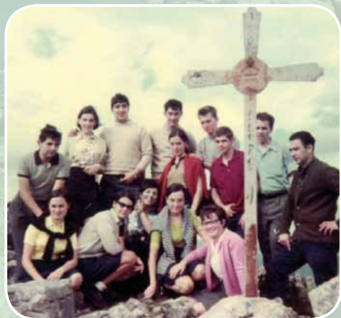
Grupo del Club Larrañeta en la cumbre con la cruz antigua (año 1969).

Asimismo, es uno de los pocos lugares de esta zona en los que se conserva la vegetación autóctona, como los bortos (madroños) y encinas de la ladera sur, o algunas hayas que resisten en la ladera norte, entre repoblaciones de cipreses. Respecto a la fauna cabe mencionar el alimoche, que se acerca a estos riscos para anidar. Su valor natural se ve reforzado por los llamados Hoyos del Gasteran , unas simas que se encuentran en la ladera sureste y que forman parte del enorme complejo kárstico de los Montes de Galdames, cuya red de galerías supera los 30 kilómetros de longitud.