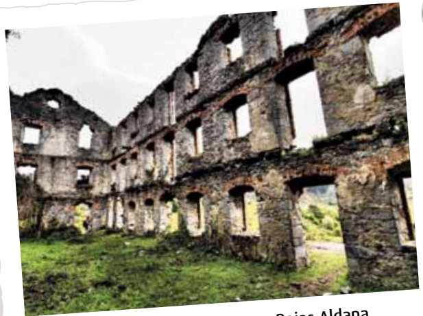
AKZESITA / ACCÉSIT