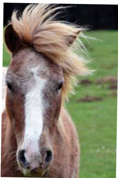
AKZESITA / ACCÉSIT

Aaron Ruiz Ugidos (Valle de Trápaga-Trapagaran)