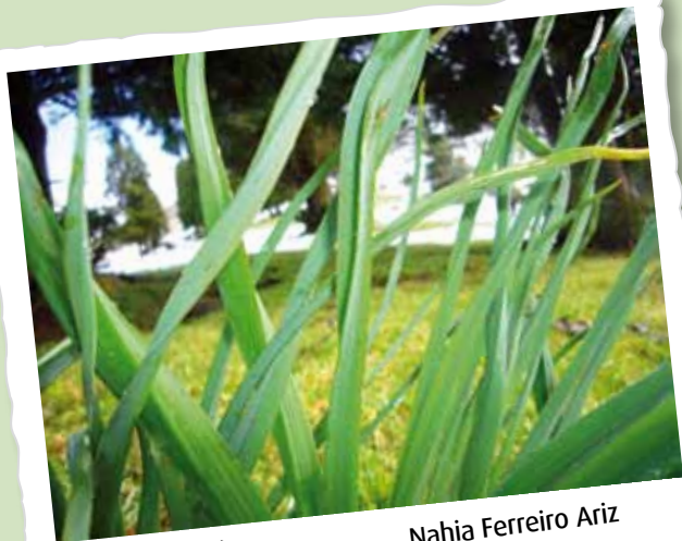
AKZESITA / ACCÉSIT