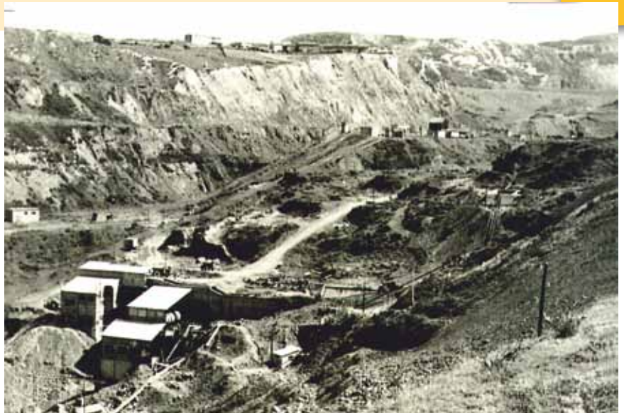
Lavadero de mineral (Matamoros) y cabeza del plano de Orconera. Arriba Larreineta (mediados siglo XX).

Tenía una huerta arrendada, cerca de casa. Allí trabajaba según el relevo que me tocaba. Muchas veces, después de las 8 horas de trabajo, me