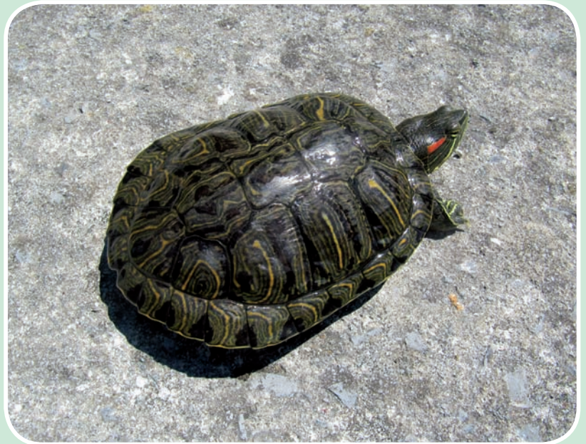
Tortuga de Florida Autor: Xabier Buenetxea.

Además de esta tortuga, característica por sus manchas rojas en la cabeza, pueden adquirirse en los comercios de animales otras tortu-