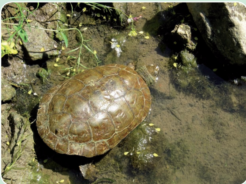
Galápagos leproso Autor: Xabier Buenetxea.