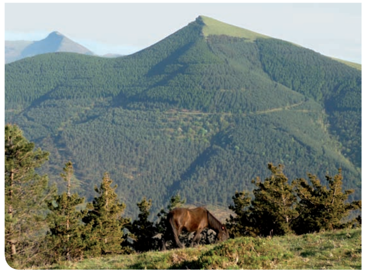
Galarraga eta Eretza mendiak.