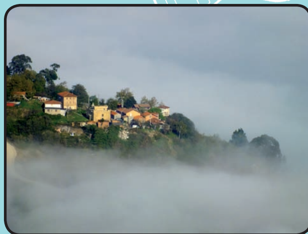
AKZESITA / ACCÉSIT

Humberto Ariz Zubiaur (Valle de Trápaga-Trapagaran)