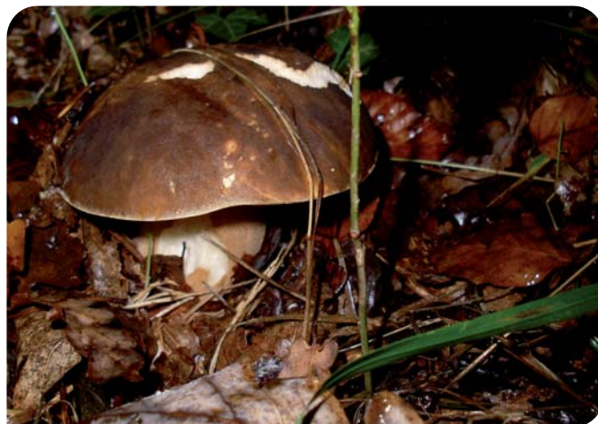
Boletus aereus (Autora: Maider Iglesias)