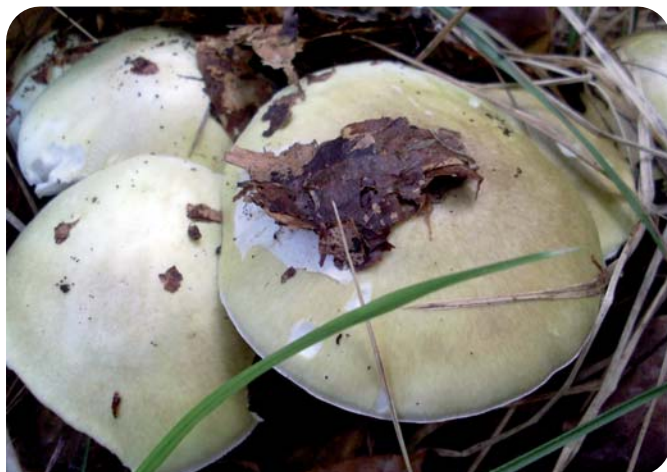
Amanita phalloides (Autora: Maider Iglesias)