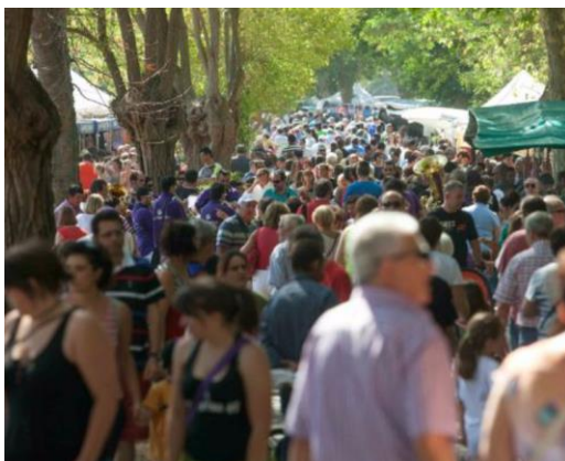
Angostoko nekazaritza- eta abeltzaintza-azoka, irailean.

Gainera, eskualdean ekimen berriak daude, oraindik gutxi badira ere, arlo hauetan: baratzezaintza ekologikoa, frutagintza, erlezaintza, esne-abeltzaintza eta beste labora alternatibo batzuk. Dena den, tokiko nekazaritza- eta abeltzaintza-produktu horien eraldaketa apenas garatu da.