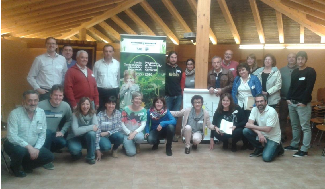
Zanbranako bigarren tailerreko partaideak.

Añanan bi tailer egin dira, bata martxoan, Zuzendaritza Batzordearekin, eta bestea apirilean, agente-sarearekin. Guztira 41 agentek parte hartu dute. Informazioa dokumentu batean bildu eta partaide guztiei bidali zitzairen, eta posta elektronikoko bidez ekarpen batzuk jaso ziren; ekarpen horiek alderatu egin dira eta egoki irizitakoak azken dokumentuan sartu dira.