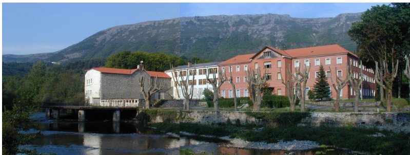
Kuartangoko bainuetxe zaharra.

Euskarari dagokionez, Eustateko 2011ko datuen arabera, Añanako biztanleen % 19 euskalduna da, % 27 ia euskalduna eta % 53 erdalduna.