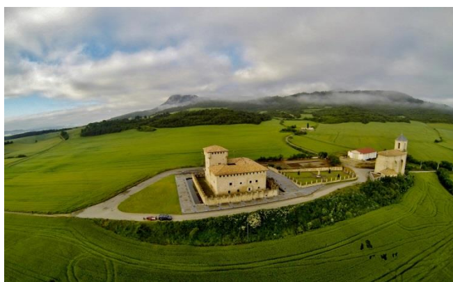
Villanañeko Varonatarren dorrea.

Gaur egun etxebizitza huts ugari daude. 2001ean 591 zeuden eta 2011n 1.200, beraz, etxebizitza hutsen kopurua % 103 igo da. Kopuru horretan sartzen dira etxebizitza eraiki berriak eta etxebizitza tradizionalak. Berriz ere, eskualdean jarduera ekonomikoa sortzea da etxebizitza horiek betetzeko modurik egokiena, eta ez oporraldietako bigarren etxebizitza bihurtzea. Horren harian, hutsik dauden etxebizitza tradizionalak bizkor hondatzen dira eta horrek, gainera, arriskuan jartzen du gure herrietako arkitektura tipikoaren iraupena. Beraz, ezinbestekoa da ohiko etxebizitzak birgaitzen laguntzea, batez ere arkitektura tradizionala duten etxebizitzak.