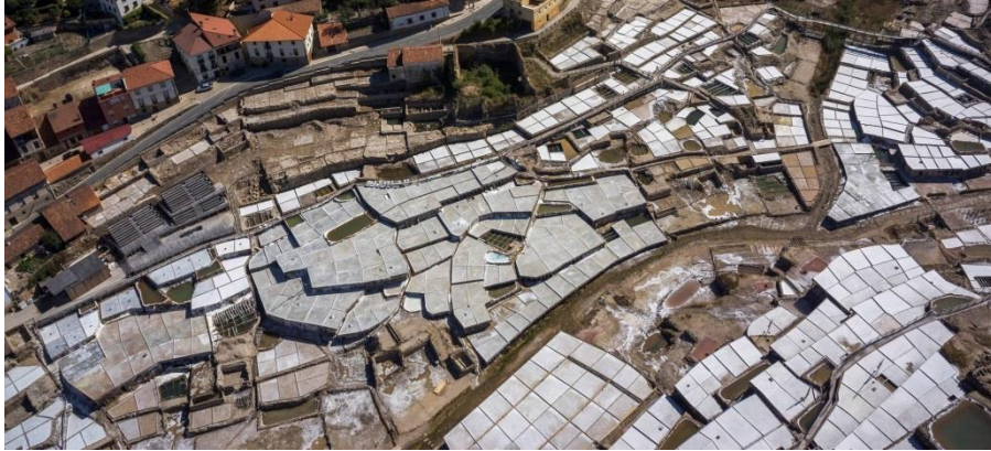
Añanako Gatz Harana.

Eskualdeko adinduen egoera kontuz hartzekoa da, eskualdean bizitzeko gero zailagoa baita burujabe izaten jarraitzea; hau da, familiarekin bizi ez diren adinduek ezin dute oinarritzko zerbitzuez gozatu: dendak, osasuna, aisia... Alde horretatik, datozen urteetan laguntza-zerbitzu berriak sustatu behar dira, besteak beste eguneko egoitzak eta etxeko arreta. Eskualdeko zahartze-tasa % 19 da, baina kasu honetan udalerrien artean alde handiak daude, adibidez: Erriberabeitiako biztanleria bikoiztu duten auzokide berri gehienak gazteak dira, eta Añanan, berriz, zahartze-tasa % 30 baino handiagoa da. Arlo honetan ere alde handiak daude eskualdeko hegoaldearen eta iparraldearen artean.