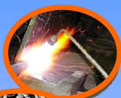
Trabajos en Caliente