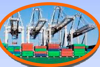
Trabajos de Especiales Características