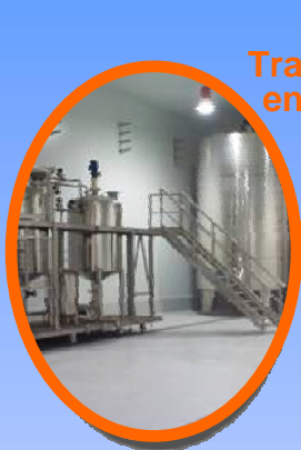
Trabajos en Frio