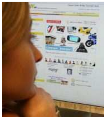
PIONERO. El pago se hace a través de la página municipal.

«El sistema de cobro está diseñado de tal manera que resulta imposible duplicar un pago. Los contribuyentes pueden estar tranquilos porque jamás pagarán dos veces un mismo recibo», explica la concejala de Economía y Hacienda. La «seguridad» y «confidencialidad» en las transacciones «también está garantizada», ya que el abono del recibo se realiza en la página web de la propia entidad financiera. El Ayuntamiento de Bilbao es la primera administración vizcaína y la única capital del País Vasco que ha implantado el sistema de la 'pasarela de pagos'.