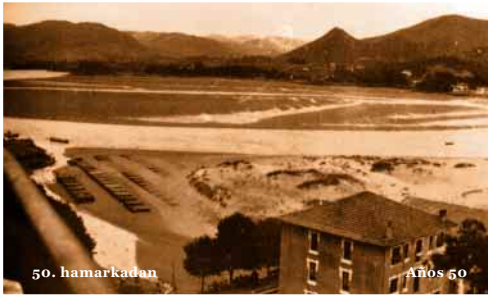
50. hamarkadan Años 50