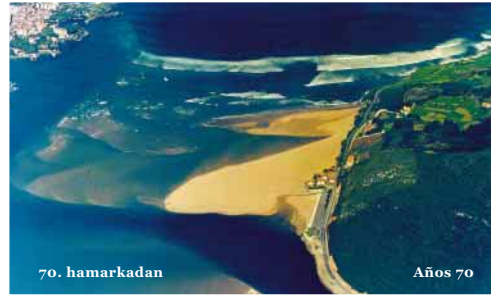
70. hamarkadan Años 70