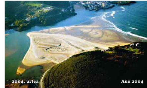
2004. urtea Año 2004

Laidako hondartzan 1950eko hamarkadaren erdialdea arte izan ziren dunak, baina itsasoko ekaitz handi baten ondorioz, desagertu egin ziren. Hortik aurrera, landareek ez dute aurrera segitzarik izan; izan ere, eremua behin eta berririo zapalduta, harea galduz joan da itsasoaren eta haizearen ekintzaren ondorioz.