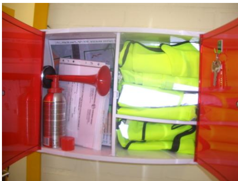
CEIP Eguzkitza HLHI (Irun)