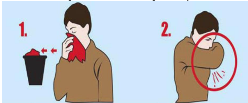
Figura 2.- Método de higiene respiratoria