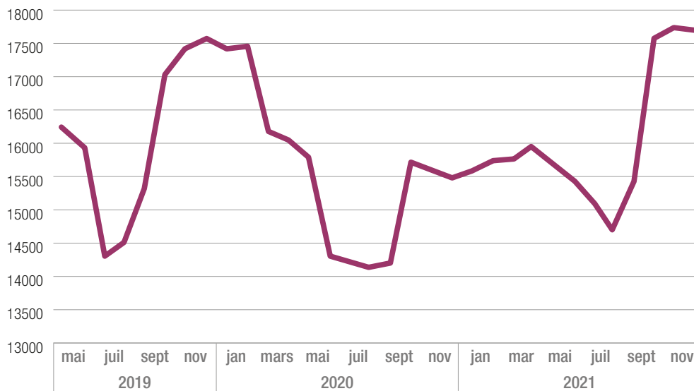
GRAPHIQUE 11.1 ÉVOLUTION DES AFFILIATIONS À LA SÉCURITÉ SOCIALE DE LA BRANCHE D'ACTIVITÉ RR ACTIVITÉS RÉCRÉATIVES ET CULTURELLES