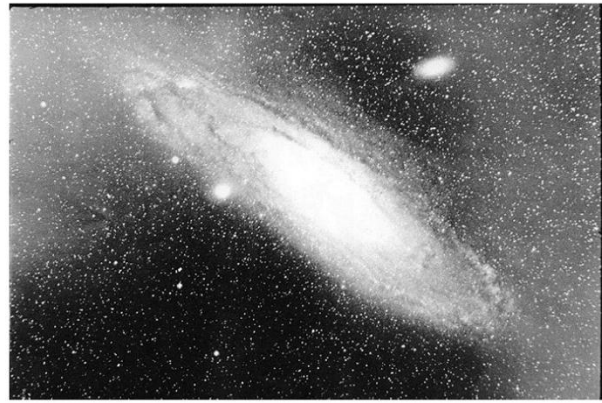
DUANE MICHALS - Giza izatea / La condición humana , 1969