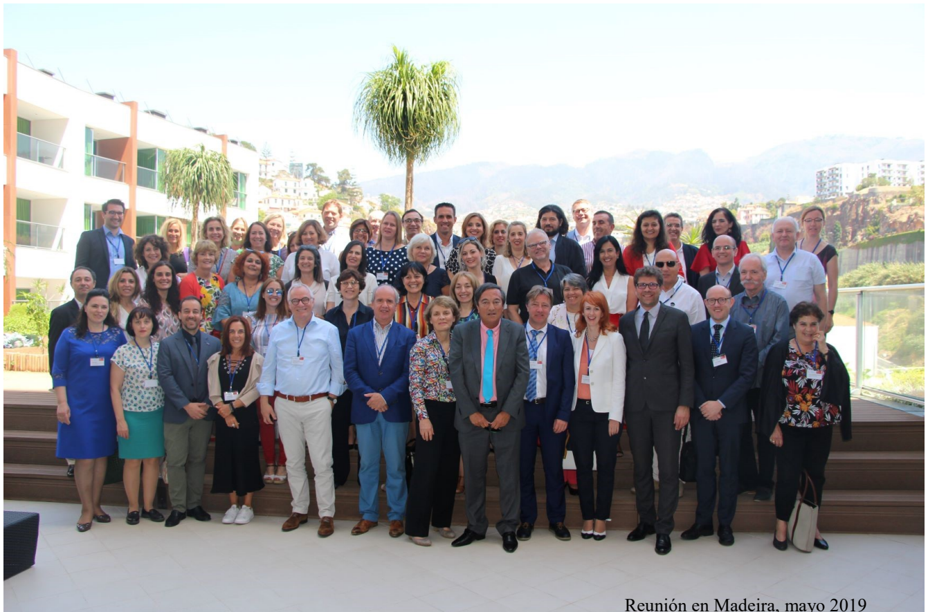
Reunión en Madeira, mayo 2019

https://www.sici-inspectorates.eu/Activities/Workshops/Strategies-and-obstacles-for-innovation,-system-wi