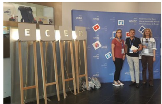
Representantes del Servicio de Evaluación de Bolzano y la Inspección del País Vasco