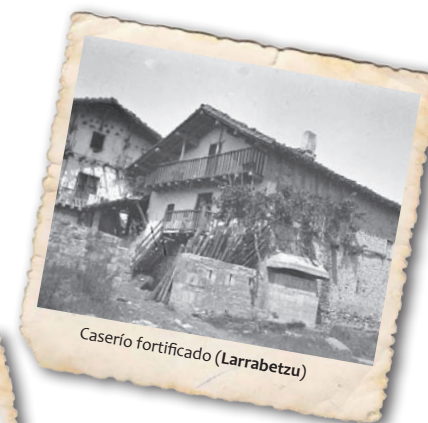
Caserío fortificado (Larrabetzu)