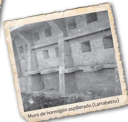
Muro de hormigón aspillero (Larrabetzu)