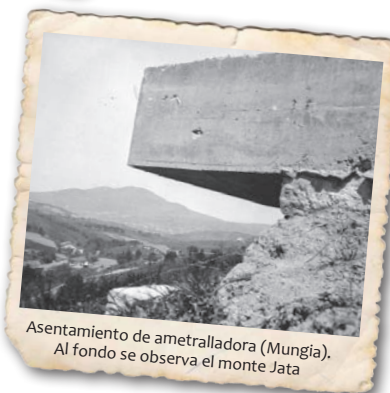
Asentamiento de ametralladora (Mungia). Al fondo se observa el monte Jata