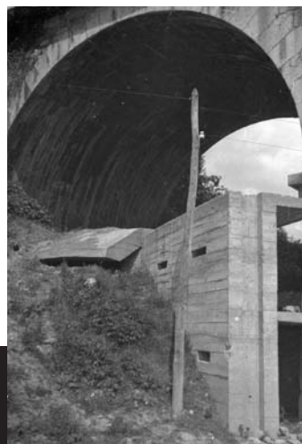
Conjunto fortificado de Uxila. Ugao-Miraballes.