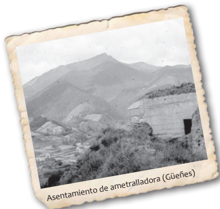
Asentamiento de ametralladora (Güeñes)