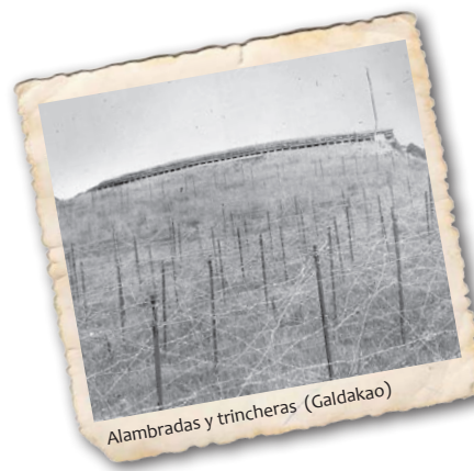
Alambradas y trincheras (Galdakao)