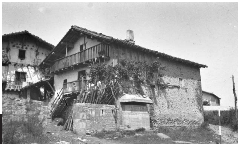
Caserío Pikene. Larrabetzu.