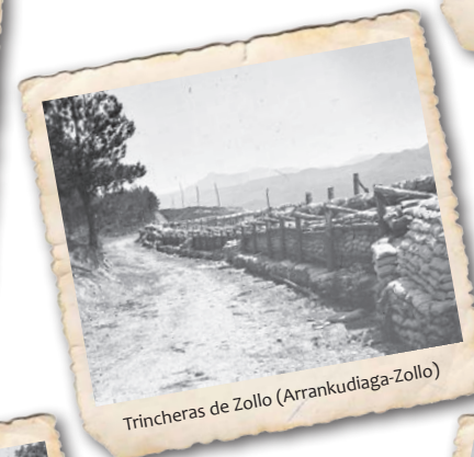
Trincheras de Zollo (Arrankudiaga-Zollo)