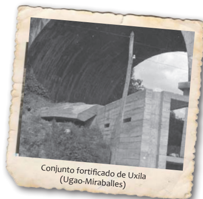
Conjunto fortificado de Uxila (Ugao-Miraballes)