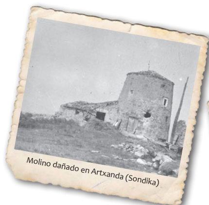
Molino dañado en Artxanda (Sondika)