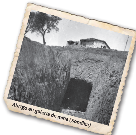
Abrigo en galería de mina (Sondika)