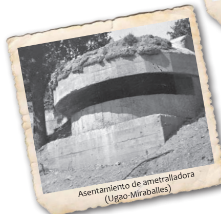
Asentamiento de ametralladora (Ugao-Miraballes)