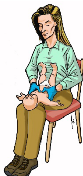
Menor de 1 año: Compresiones torácicas