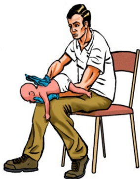
Menor de 1 año: Golpes interescapulares