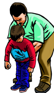
Mayor de 1 año: Maniobra de Heimlich