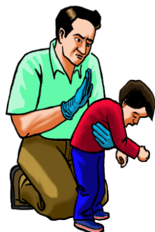
Mayor de 1 año: Golpes interescapulares