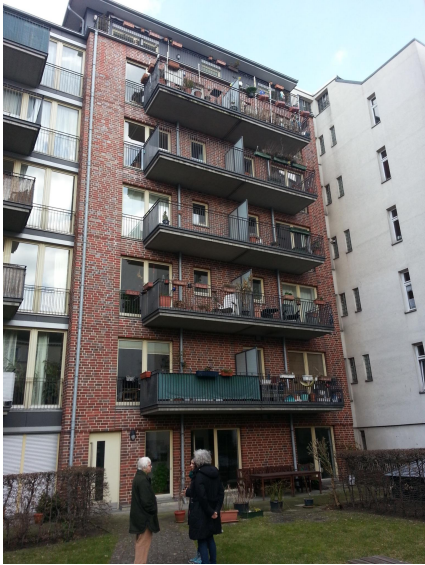
Arche Nora I