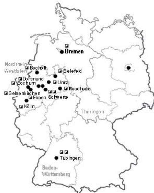
17 proyectos de Beginenhof