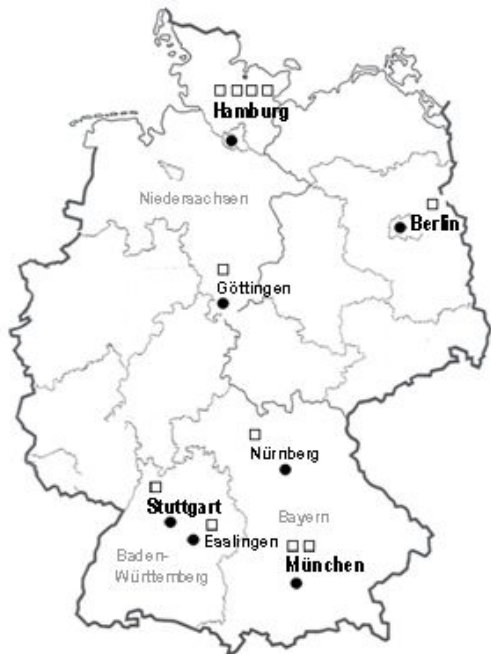
14 proyectos por y para mujeres mayores