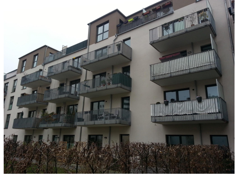
Arche Nora III