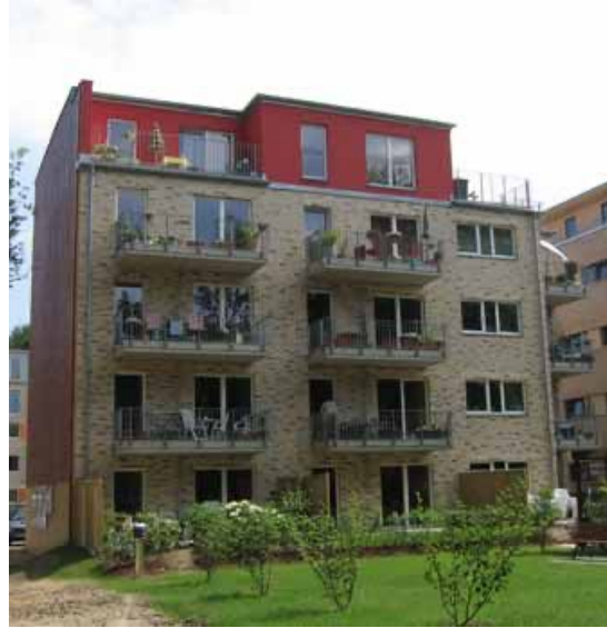
Arche Nora II