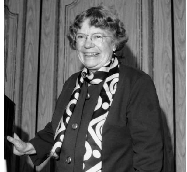
Margaret Mead 1901-1978

“El primer signo de civilización en una cultura antigua era un fémur que se había roto y luego sanado... Un fémur roto que se ha curado es evidencia de que alguien se ha tomado el tiempo para quedarse con el que se cayó, ha vendado la herida, le ha llevado a un lugar seguro y le ha ayudado a recuperarse”