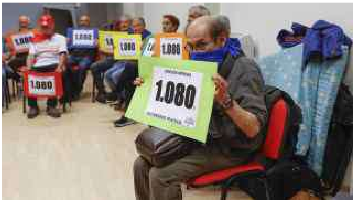
El movimiento de pensionistas de Bizkaia ha iniciado este lunes en Bilbao un ayuno y encierro, para reivindicar unas pensiones mínimas de 1.080 euros.

Para ello, Etxebarria solicita "un nuevo marco jurídico y tributario que posibilite o ayude a conseguir dicho objetivo". En este sentido, señala, "la vía más adecuada para la generalización de la Previsión Social Complementaria (PSC) es la previsión social de empleo y, en concreto, los planes de empleo preferentes, sin olvidar el importante papel que desempeñan el resto de modalidades."