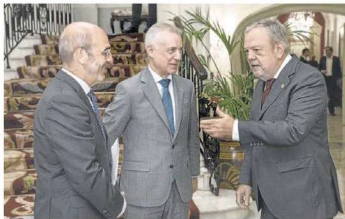
Ignacio Etxebarria, presidente de la Federación de EPSV, el lehendakari Urkullu y el consejero Azpiroz.

En el sector del vidrio destaca Guardian, con 1,3 millones, los mismos que se ha adjudicado a la fabricante vizcaína Vicrila.