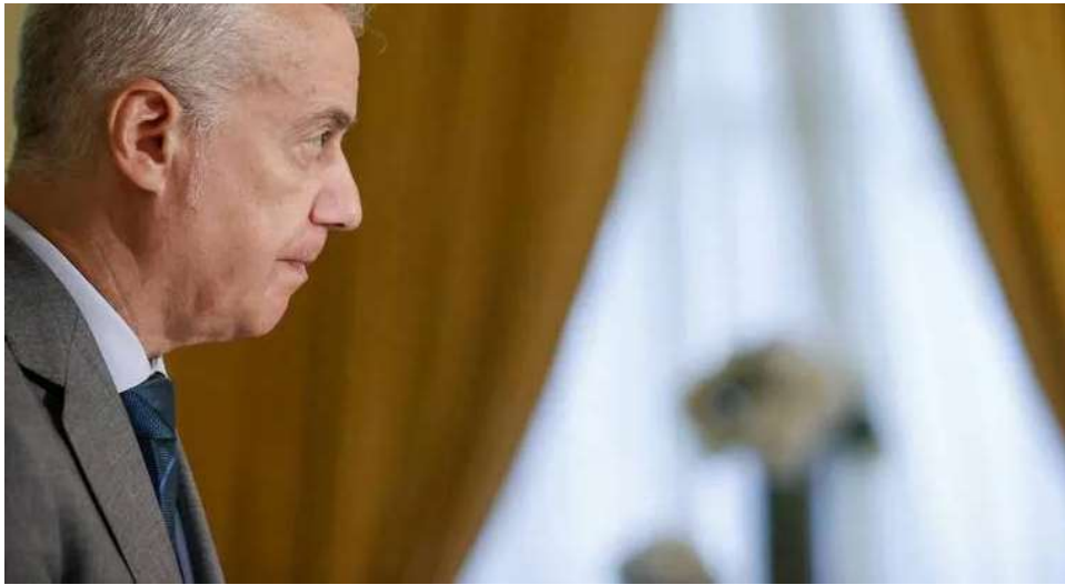
El lehendakari Urkullu en el 40 aniversario de la primera ley vasca de EPSV