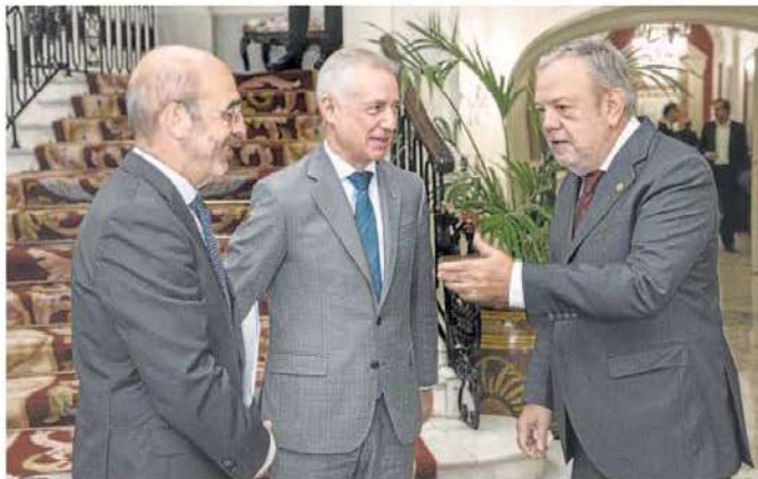
Ignacio Etxebarria, presidente de la Federación de EPSV, el lehendakari Urkullu y el consejero Azpiroz.

En el sector del vidrio destaca Guardian, con 1,3 millones, los mismos que se ha adjudicado a la fabricante vizcaína Vicirla.