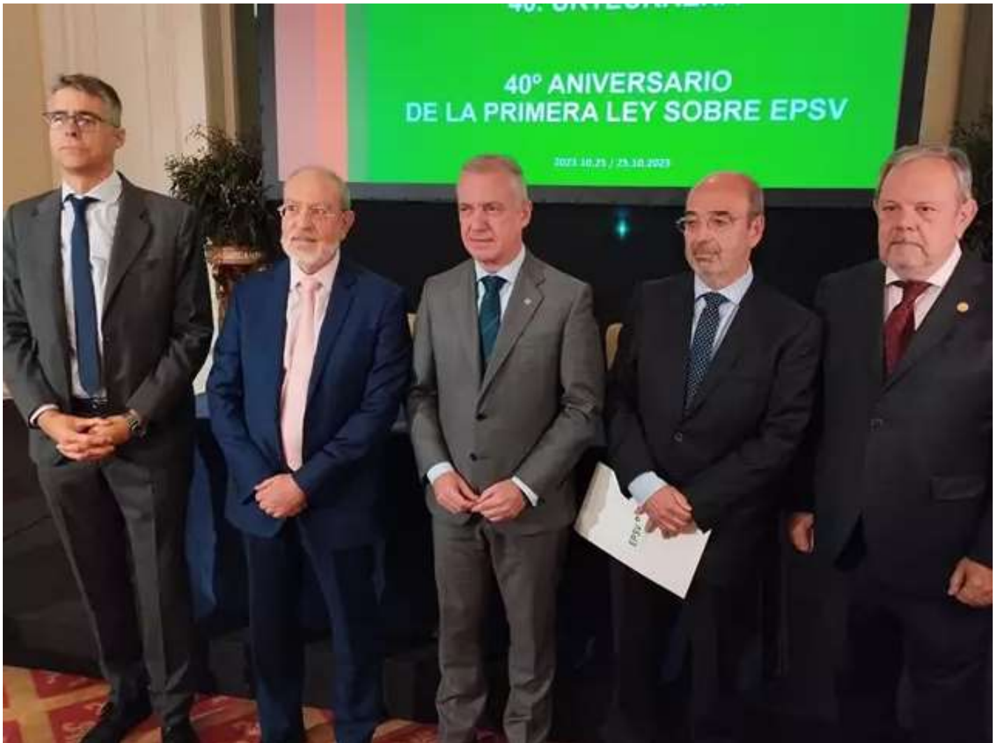
Celebración en Bilbao con motivo del 40º aniversario de la primera ley sobre las EPSV.