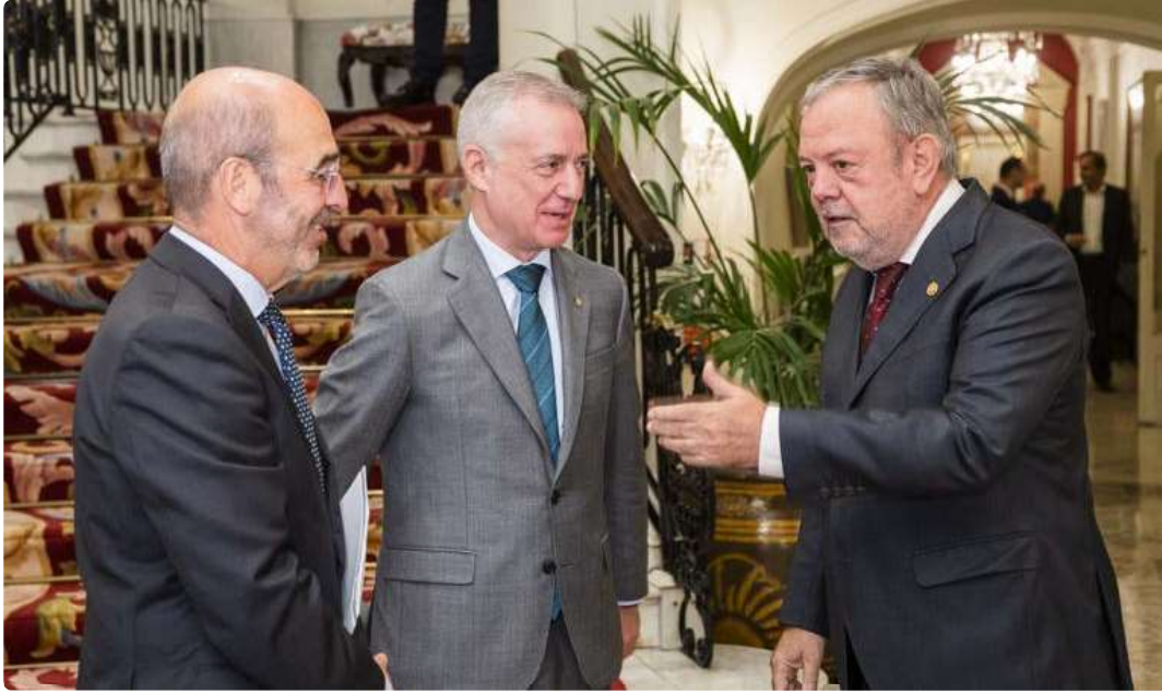
Euskadi mejorará los beneficios fiscales a los planes de pensiones para generalizarlos entre los trabajadores

Euskadi prevé mejorar los beneficios fiscales de las sistemas de previsión social complementaria del empleo para fomentar su generalización entre los trabajadores. Así, lo ha adelantado el lehendakari del Gobierno Vasco, Iñigo Urkullu, en el acto de celebración del 40 aniversario de la primera ley sobre las entidades de previsión social voluntaria (EPSV).