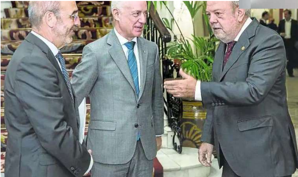
Ignacio Etxebarria, presidente de la Federación de EPSV, el lehendakari Urkullu y el consejero Azpiazu. Irekia