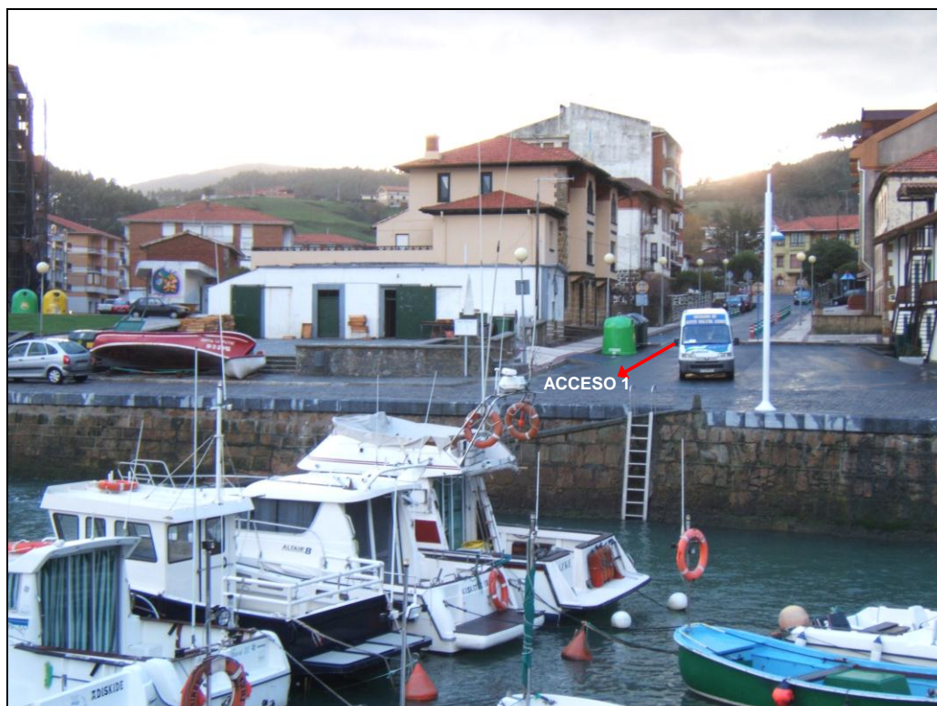
Fig 3. Accesos al Puerto.

No dispone de controles de acceso para la regulación del tráfico por carretera dentro de la zona portuaria.