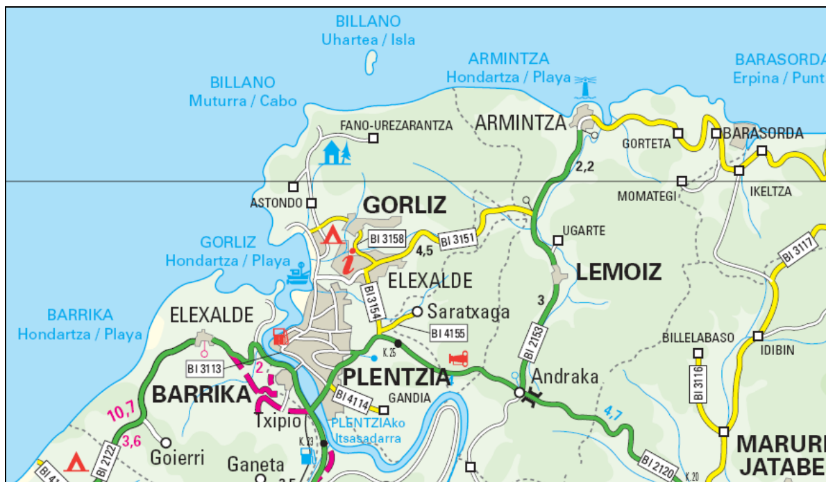
Fig 2. Accesos por carretera.