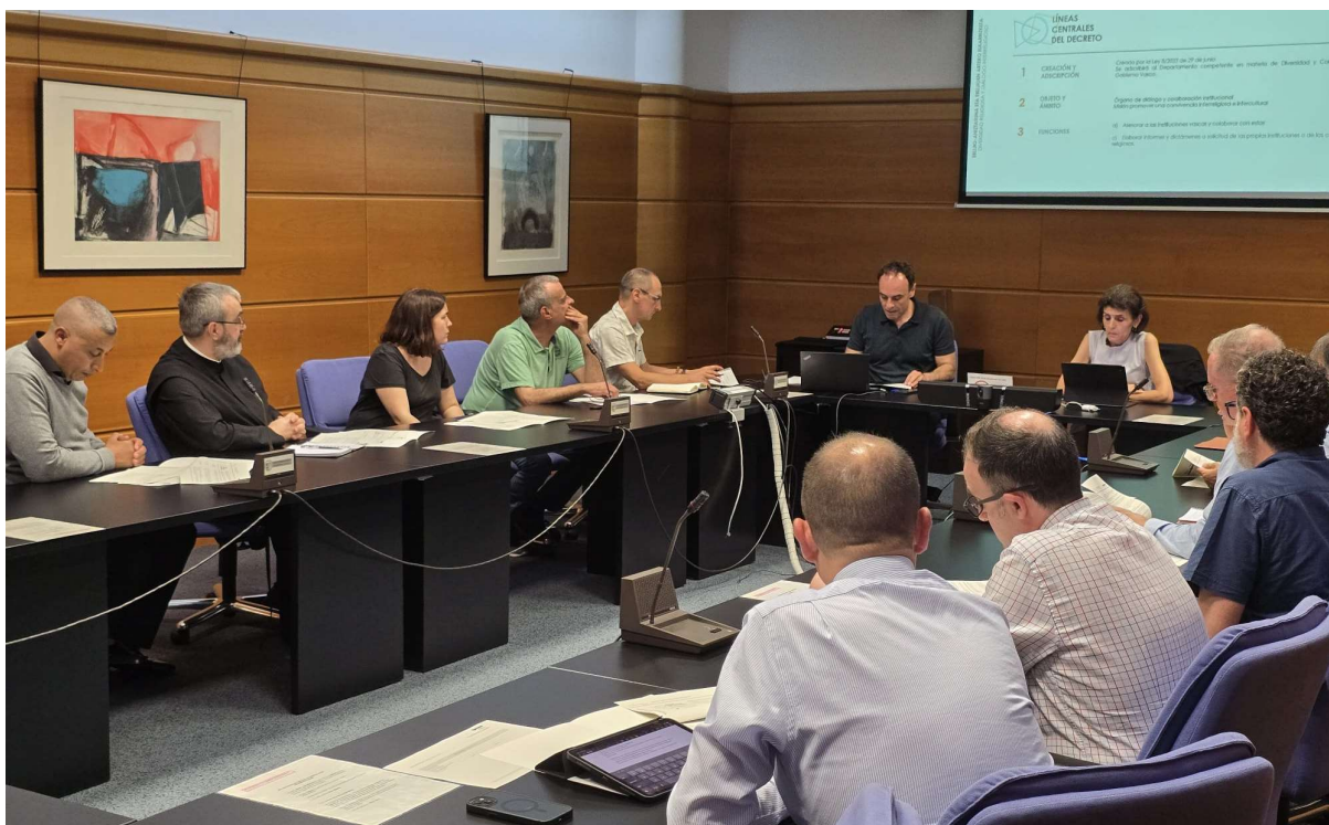
EAeko Erlijioen arteko Kontseiluaren prozesuari ekiteko Euskadiko erlijio-komunitateekin izandako lehen elkarrizketa-saioa (2025/06/26).